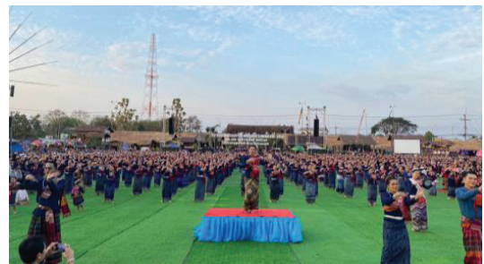
ภาพที่ 2 การรำบวงสรวง

โดยองค์การบริหารส่วนจังหวัดสกลนครมีส่วนร่วมในการสนับสนุนงบประมาณในการจัดงาน ของเทศบาลตำบลกุสุมาลย์มีส่วนร่วมในการจัดตั้งงบประมาณในการจัดงานและรับผิดชอบในการปฏิบัติงานเกี่ยวกับการจัดงาน ในส่วนขององค์การบริหารส่วนตำบลทั้ง 5 ตำบลมีส่วนร่วมในการจัดตั้งงบประมาณ การจัดนิทรรศการบ้านเรือนไทโส้ และภาครัฐตลอดจนภาคประชาชนมีส่วนร่วมในการแต่งกาย การเดินขบวนวิถีชีวิตของชาวไทโส้ การรำบวงสรวง และการแสดงแลกเปลี่ยนศิลปวัฒนธรรมภูมิปัญญาท้องถิ่นของชาวไทโส้