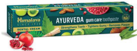
ภาพประกอบ 1 ผลิตภัณฑ์ยาสีฟันอายุรเวทยี่ห้อหิมาลายา

นอกจากนี้ กลุ่มคนส่วนใหญ่มีความเห็นว่ายาแผนปัจจุบันอาจส่งผลกระทบต่อร่างกายหลายประการ อาจไม่มีตัวารองรับโรคใหม่ๆ ที่อาจเกิดขึ้นได้ในปัจจุบัน ต่างจากศาสตร์อายุรเวทที่การใช้ยาสมุนไพรมีประโยชน์มากมาย ไม่มีวันหมดอายุ และมีความเสถียรมากกว่า อีกทั้งในปัจจุบันยังมีการนำหลักการอายุรเวทมาใช้ในการผลิตสินค้าเพื่อสุขภาพและความงาม ทำให้อายุรเวทมีความทันสมัยและได้รับความนิยมในหมู่ผู้รักสุขภาพมากยิ่งขึ้น เช่น ผลิตภัณฑ์ยาสีฟันอายุรเวทยี่ห้อหิมาลายา (Himalaya) ประเทศอินเดีย มีส่วนผสมของสมุนไพรอายุรเวทถึง 13 ชนิด เช่น สะเดาอินเดีย ทับทิม ตรีผลา ส้มกุ่ม ดังภาพประกอบ