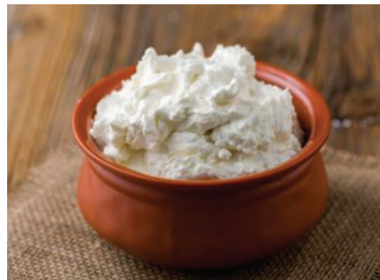
ภาพประกอบ 3 มลาอี