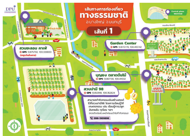
ภาพที่ 3 แผนที่เส้นทางการท่องเที่ยวทางธรรมชาติในอำเภอบางใหญ่ จังหวัดนนทบุรี เส้นทางที่ 1

เส้นทางที่ 2 ป่าจ๊ีบ ฟาร์ม (Pa Jeep Farm) ตลาดขายส่งต้นไม้พระเงิน และ Garden'9 Café กิจกรรมเชิงสร้างสรรค์ในเส้นทาง คือ กิจกรรมการเรียนรู้วิถีเกษตรกรรมในป่าจ๊ีบ ฟาร์ม (Pa Jeep Farm) โดยเฉพาะกับเด็กและเยาวชน เช่น การเพาะเลี้ยงกบนา การลงโคลนดำนาปลูกข้าว การดูกรรมวิธี ไก่ฟักไข่ ฯลฯ (ควรติดต่อล่วงหน้าก่อนเข้าไปทำกิจกรรม) (ดูภาพที่ 4 ประกอบ)