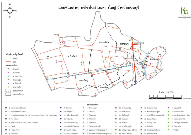
ภาพที่ 2 แผนที่แสดงการกระจายของแหล่งท่องเที่ยวในอำเภอบางใหญ่ จังหวัดนนทบุรี

ทรัพยากรการท่องเที่ยวในอำเภอ บางใหญ่ จังหวัดนนทบุรีแสดงเป็นแผนที่แสดงการกระจายของที่ตั้งได้ดังภาพที่ 2