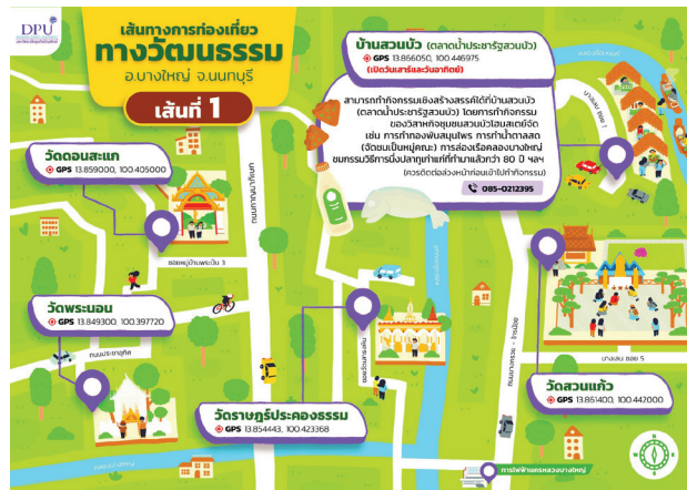
ภาพที่ 5 แผนที่เส้นทางท่องเที่ยวทางวัฒนธรรมในอำเภอบางใหญ่ จังหวัดนนทบุรี เส้นทางที่ 1

เส้นทางที่ 2 บ้านสุขไพมูลย์โฮมสเตย์หรือ The Thai House & Thai Cooking Experiences วัดคงคา ตลาดน้ำบางคูวัด ศาลเจ้าพ่อจ้อยบางคูวัด วัดปรังค์หลวง และวัดอัมพวัน กิจกรรมเชิงสร้างสรรค์ในเส้นทาง คือ กิจกรรมเรียนรู้การทำอาหารไทยโบราณที่บ้านสุขไพมูลย์โฮมสเตย์ เช่น ขนมเบื้องญวน 2 ตำหรับ ยำวันเส้นอัญมณี แกงแดง ก๋วยเตี๋ยวชเนร ฯลฯ (ควรติดต่อล่วงหน้าก่อนเข้าไปทำกิจกรรม) (ดูภาพที่ 6 ประกอบ)