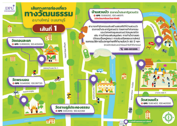
ภาพที่ 5 แผนที่เส้นทางการท่องเที่ยวทางวัฒนธรรมในอำเภอบางใหญ่ จังหวัดนนทบุรี เส้นทางที่ 1

เส้นทางที่ 2 บ้านสุขใจพบูลย์โฮมสเตย์หรือ The Thai House & Thai Cooking Experiences วัดคงคา ตลาดน้ำบางคูวัด ศาลเจ้าพ่อจ้อยบางคูวัด วัดปรังค์หลวง และวัดอัมพวัน กิจกรรมเชิงสร้างสรรค์ในเส้นทาง คือ กิจกรรมเรียนรู้การทำอาหารไทยโบราณที่บ้านสุขใจพบูลย์โฮมสเตย์ เช่น ขนมเบื้องญวน 2 ตำหรับ ยำวันเส้นอัญมณี แกงแดง ก๋วยเตี๋ยวแซ่ ฯลฯ (ควรติดต่อล่วงหน้าก่อนเข้าไปทำกิจกรรม) (ดูภาพที่ 6 ประกอบ)