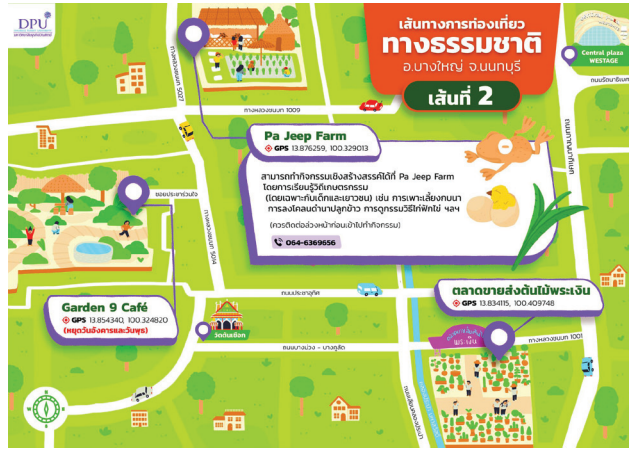
ภาพที่ 4 แผนที่เส้นทางท่องเที่ยวทางธรรมชาติในอำเภอบางใหญ่ จังหวัดนนทบุรี เส้นทางที่ 2

เส้นทางท่องเที่ยวทางวัฒนธรรม เส้นทางที่ 1 วัดสวนแก้ว บ้านสวนบัว (ตลาดน้ำพระราชวังสวนบัว) วัดดอนสะแก วัดราษฎร์ประคองธรรม และวัดพระนอน กิจกรรมเชิงสร้างสรรค์ในเส้นทาง คือ กิจกรรมของวิสาหกิจชุมชนบ้านสวนบัว เช่น การทำทองพับสมุนไพรรักษาโรค (จัดดำเนินการเป็นหมู่คณะ) การล่องเรือคลองอ้อมนนท์และคลองบางใหญ่ ชมกรรมวิธีการนึ่งปลาทุเก้แก่ที่ทำมาแล้วกว่า 80 ปี ฯลฯ (ควรติดต่อล่วงหน้าก่อนเข้าไปทำกิจกรรม) (ดูภาพที่ 5 ประกอบ)