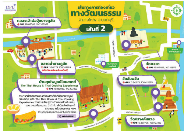
ภาพที่ 6 แผนที่เส้นทางท่องเที่ยวทางวัฒนธรรมในอำเภอบางใหญ่ จังหวัดนนทบุรี เส้นทางที่ 2