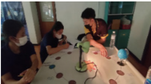
ภาพที่ 1 การเรียนการสอนแบบจำลอง เป็นฐานเรื่องฤดูกาล

3.2.2 ผู้วิจัยดำเนินการสอน ตามกรอบ TPACK MODEL ในชั้นเรียนปกติโดย ผู้วิจัยจัดการเรียนรู้แบบจำลองเป็นฐาน (Model- based Learning) (ดังภาพที่ 1 และ ภาพที่ 2) ให้ ผู้เรียนลงมือปฏิบัติกิจกรรมด้วยตนเอง กิจกรรมนี้ ประยุกต์จากเอกสารประชุมปฏิบัติการพัฒนาครู กลุ่มสูงกลุ่มสาระวิทยาศาสตร์ระดับประถมศึกษา สถาบันส่งเสริมการสอนวิทยาศาสตร์และเทคโนโลยี ร่วมกับสำนักงานคณะกรรมการการศึกษาขั้นพื้นฐาน (สถาบันส่งเสริมการสอนวิทยาศาสตร์และ เทคโนโลยี, 2554) เลือกใช้โปรแกรมจำลอง Class Action จากเว็บไซต์ UNL Astronomy Education ประกอบการอธิบายเพิ่มเติม (ดังภาพที่ 3 และ ภาพที่ 4) และมอบหมายกิจกรรมแบบฝึกหัดเพิ่ม เติมสำหรับเนื้อหาฤดูกาลและข้างขึ้นข้างแรมแบบ ออนไลน์ผ่าน Google Classroom เพื่อส่งงาน ติดตามงาน และเฉลยแบบฝึกหัดร่วมกับการสอน ปกติในชั้นเรียน (ดังภาพที่ 5)