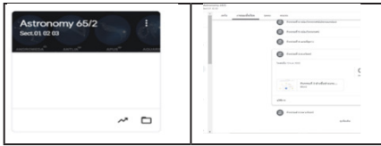
ภาพที่ 5 ห้องเรียน Google Classroom วิชาดาราศาสตร์

3.2.3 ให้ผู้เรียนทำแบบทดสอบ วัดผลสัมฤทธิ์ทางการเรียนหลังเรียน