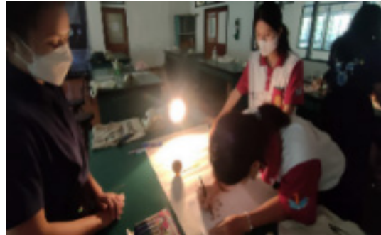
ภาพที่ 2 การเรียนการสอนแบบจำลอง เป็นฐานเรื่องข้างขึ้นข้างแรม