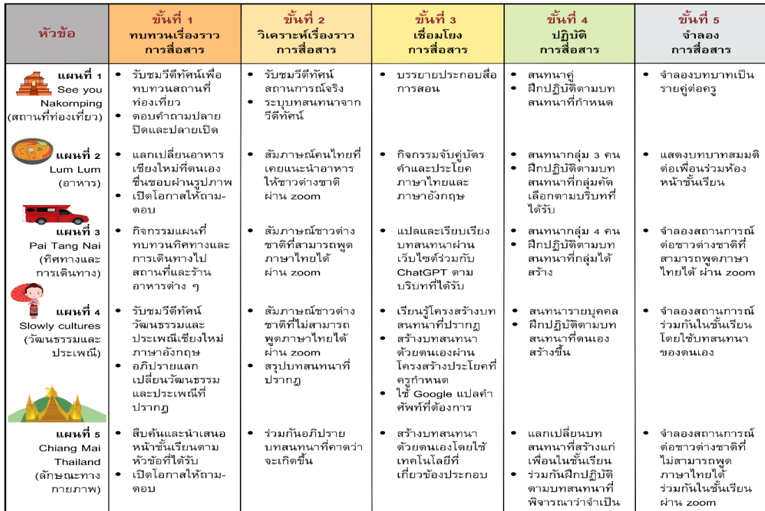
แผนภาพที่ 3 การออกแบบแผนการจัดการเรียนรู้ในแต่ละขั้นตอนการจัดการเรียนรู้ในงานวิจัย

ขั้นตอนที่ 5 จำลองการสื่อสาร เป็นการให้นักเรียนได้ทดลองสื่อสารหลังจากที่ได้ฝึกฝน โดยใช้บทสนทนาที่ออกแบบหรือที่ได้แลกเปลี่ยนกันในห้องเรียนประกอบการสนทนา โดยเน้นการออกแบบกิจกรรมที่เป็นการจำลองสถานการณ์ให้ใกล้เคียงกับสภาพจริงอย่างมากที่สุด และมีความท้าทายเพิ่มมากขึ้นตามลำดับ ตั้งแต่การสนทนาต่อหน้าครูที่สอน หน้าชั้นเรียน จัดบรรยากาศในห้องเรียน ไปจนถึงการสนทนากับชาวต่างชาติผ่านแอปพลิเคชัน Zoom Meetings