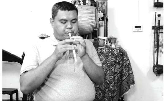
ภาพที่ 4 ภาพตัวอย่างการจัดวางข้อมูลและ ภาพประกอบ (ที่มา: อัครวัตร เชื่อมกลาง)

อธิบายประวัติ ลักษณะโดยทั่วไป ประเภท กลุ่มของเครื่องดนตรี วิธีการบรรเลงและภาพ ประกอบ