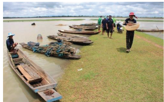
ภาพประกอบ 2-3 วิธีควายน้ำและประมงพื้นบ้านริมน้ำ