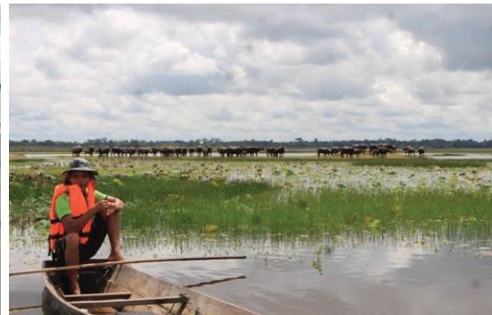
ภาพประกอบ 4-5 กิจกรรมนั่งเรือชมควาย

2. ฐานเรียนรู้การทอเสื่อกก เป็นฐานเรียนรู้ที่ตั้งอยู่ที่บ้านสมบูรณ์ และบ้านโคกสนวน มีสมาชิกกลุ่มจำนวนประมาณ 30 คน เนื่องจากเป็นชุมชนริมน้ำ จึงมีกักขังจำนวนมาก ทำให้ชาวบ้านในชุมชนมีอาชีพเสริม คือ การทอเสื่อกก จุดเด่นของการทอเสื่อกกของชุมชนที่ไม่เหมือนชุมชนอื่นคือ การทอเสื่อโดยไม่ใช้กี่ทอ แต่เป็นการทอด้วยมือและเท้า เสื่อมีลวดลายเรียบง่าย สีสันไม่ฉูดฉาด นอกจากนี้ บ้านสมบูรณ์ยังมีการแปรรูปผลิตภัณฑ์