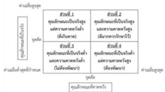
ภาพที่ 2 เมทริกซ์การวิเคราะห์หาคุณลักษณะของครู ที่ดี ในความคิดเห็นของคนที่ประสบความสำเร็จ ในชีวิตที่ควรพัฒนา

3. การวิเคราะห์เมทริกซ์ (Matrix Analysis) ใช้สำหรับการวิเคราะห์หาคุณลักษณะ ของครูที่ดีในความคิดเห็นของคนที่ประสบความสำเร็จ ในชีวิตที่ควรได้รับการพัฒนา โดยแบ่ง ตารางออกเป็น 4 ส่วนดังนี้