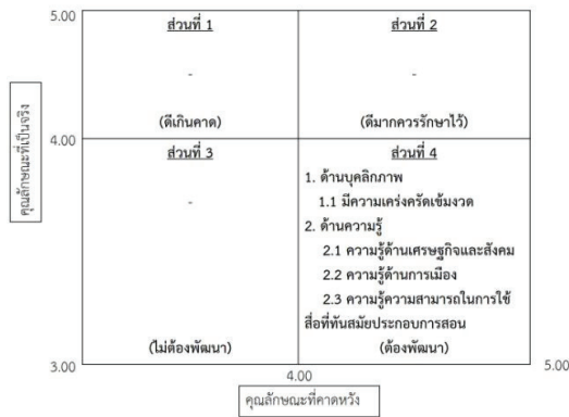
ภาพที่ 3 เมทริกซ์การวิเคราะห์หาคุณลักษณะของครูที่ดีในความคิดเห็นของคนประสบความสำเร็จในชีวิตที่ต้องพัฒนาโดยพิจารณาจุดตัดที่ค่าเฉลี่ย 4.00 จากค่าเฉลี่ยเต็ม 5.00

จากภาพที่ 3 พบว่าคุณลักษณะของครูที่ดีในความคิดเห็นของคนประสบความสำเร็จในชีวิตที่ควรพัฒนา มี 2 ด้านคือ ด้านบุคลิกภาพที่มีความเคร่งครัดเข้มงวด และด้านความรู้ ได้แก่ ความรู้ด้านเศรษฐกิจและสังคม ความรู้ด้านการเมือง และความรู้ความสามารถในการใช้สื่อที่ทันสมัยประกอบการสอน