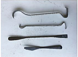
ชุดเครื่องมือพลาสติก