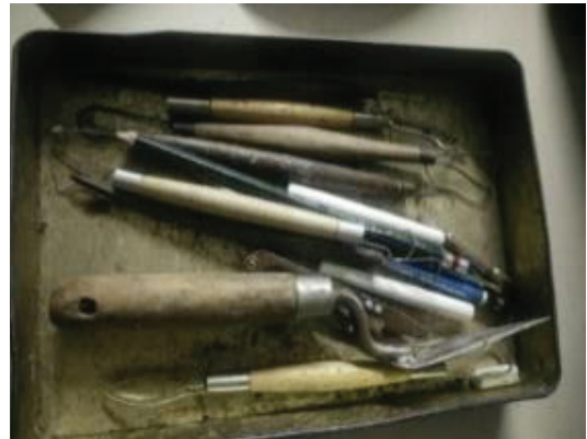
ภาพที่ 4 ภาพเครื่องมือในการแกะต้นเทียนพรรษา ของนายประเสริฐ เลิศธีรศิลป์

จากภาพเครื่องมือเครื่องมือในการแกะต้นเทียนพรรษาทั้ง 3 ภาพข้างต้น พบว่า เครื่องมือในการแกะต้นเทียนพรรษาของช่างใหญ่ และลูกศิษย์ทั้ง 2 ท่าน ประกอบไปด้วย ไม้ปั่น เกียงปาด ยังมีการประยุกต์ใช้เครื่องมืออื่น เข้ามาเพื่อช่วยให้ง่ายต่อการแกะต้นเทียนพรรษา