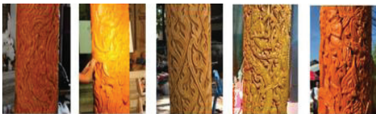
ภาพที่ 9 ภาพลวดลายต้นเทียนของช่าง ในจังหวัดนครราชสีมา