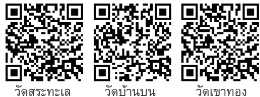
วัดสระทะเล วัดบ้านบน วัดเขาทอง

ผลการศึกษาตามวัตถุประสงค์ข้อที่ 1 ได้องค์ความรู้เกี่ยวกับทรัพยากรการท่องเที่ยวตามเส้นทางการเรียนรู้ของหลวงพ่อดิมที่ปรากฏดัง E-Book ต่อไปนี้