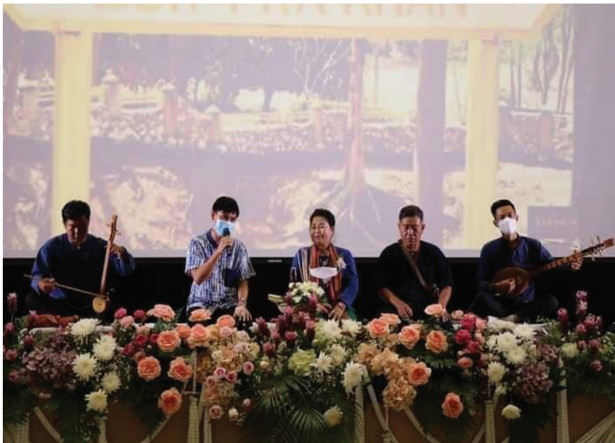
ภาพที่ 2 การแสดงวงดนตรีพื้นบ้านสะล้อ ซอ ซึง คณะสงฆ์น่าน ที่มหาวิทยาลัยนครสวรรค์ จังหวัดพิษณุโลก