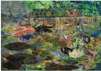
อัครลักษณะแห่งสายน้ำ ขนาด 50 x 60 ซม.

- บรรยายภาพของช่วงเวลากลางวัน เหล่าบรรดาสัตว์มีชีวิตต่างแสดงลีลา แสดงพฤติกรรมที่กำลังเพลิดเพลินในจังหวะช่วงเวลา ต่างตีความกับท้องทุ่งธรรมชาติที่แท้จริง