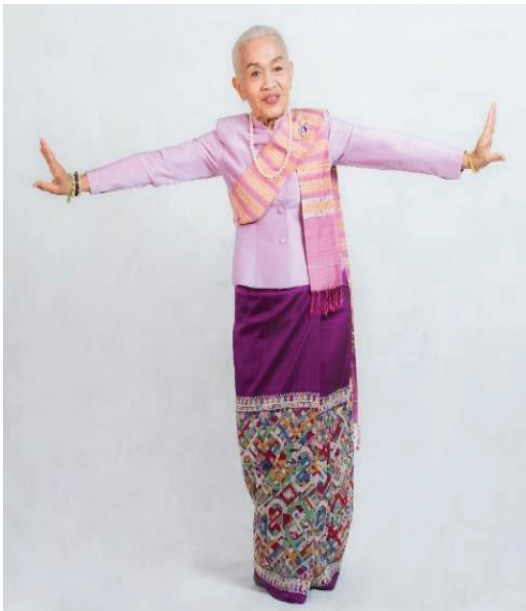
ภาพประกอบ 4 รำกว้าง

แสดงถึงความสง่างามและความภูมิฐาน จากค่านิยมการรำกว้างหากพิจารณาจากองศาของการเคลื่อนไหวร่างกายอธิบายได้ว่า ระดับของมือจากจุดตั้งต้นโดยประมาณ 50 องศา จากนั้นใช้ส่วนของแขนเคลื่อนไหวลีลาท่าทางจากจุดตั้งต้นถึงระดับไหล่ประมาณ 90 องศาและขึ้นสูงเหนือระดับศีรษะประมาณ 180 องศา