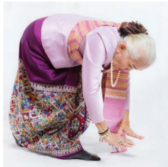
ภาพประกอบ 3 ก้มต่ำ

ก้มต่ำ คือ มีลักษณะการเคลื่อนไหว ร่างกายโดย ส่วนของศีรษะและลำตัวโน้มลงมา ด้านหน้าให้บริเวณหลังของผู้แสดงระนาบเป็น เส้นตรงเมื่อวิเคราะห์ความสัมพันธ์เกี่ยวกับระดับ ความโค้งของสันหลังในส่วนของตำแหน่งตั้งต้น คือ ยืนตรง 0 องศา ระดับการก้มของลำตัวให้ บริเวณส่วนโค้งของหลังจากจุดตั้งต้นให้อยู่ใน ระดับ 60-80 องศาซึ่งเป็นตัวบ่งชี้นาฏยลักษณะ เฉพาะของการฟ้อนอีสานอันแสดงถึงความ แข็งแกร่ง หนักแน่นและมั่นคง