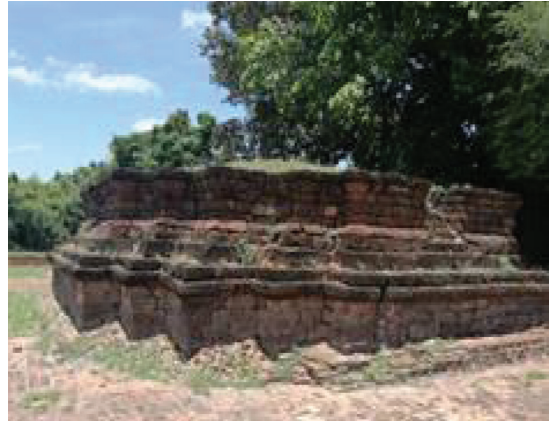
ภาพประกอบ 3 โบราณสถานวัดซาก

2) วัดถนนใหญ่ สร้างขึ้นตั้งแต่ปี พ.ศ. 2335 ในช่วงสมัยรัชกาลที่ 1 โดยการนำของครูบาสิงห์ วัดถนนใหญ่ มีพื้นที่เป็นเนินสูง ภายในบริเวณวัดมีโบราณสถานเก่าแก่ เป็นอุโบสถโบราณที่มีลักษณะแปลกกว่าอุโบสถอื่นๆ คืออุโบสถมหาอุดมภ์ เป็นโบสถ์ที่มีประตูเข้า-ออกทางเดียว สันนิษฐานว่าสร้างขึ้นมาในสมัยกรุงศรีอยุธยาตอนต้น เหตุที่มีทางเข้าออกเพียงทางเดียว เชื่อกันว่าเป็นสถานที่ไว้ทำพิธีกรรมในการลงของอาคมต่างๆ ที่ใช้ในการออกศึกสงคราม อุโบสถมีขนาดกว้าง 6 เมตร ยาว 15 เมตร สร้างเมื่อปี พ.ศ. 2338 ก่ออิฐก่อใหญ่ฉาบผนังด้วยปูน นอกจากนี้ ที่วัดถนนใหญ่ยังมีโบราณสถานที่สำคัญ ได้แก่ เสาหงส์ บ่อน้ำเก่าที่มีน้ำตลอดปี (สมาร์ท เอส เอ็ม อี, 2564)