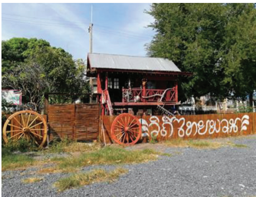
ภาพประกอบ 9 พิพิธภัณฑ์ของชาวไทยพวน ตำบลถนนใหญ่

พิพิธภัณฑ์อยู่ในบริเวณศูนย์วัฒนธรรมไทยพวน ตำบลถนนใหญ่ ตั้งอยู่ในหมู่ที่ 5 ตำบลถนนใหญ่ อำเภอเมือง จังหวัดลพบุรี ชุมชนไทยพวนถนนใหญ่ต้องการให้พิพิธภัณฑ์ เป็นแหล่งรวบรวมและอนุรักษ์เครื่องใช้ที่แตกต่างๆ ในวิถีชีวิต เป็นแหล่งการจัดการแสดงเฉพาะด้านที่ให้ความรู้แก่นักท่องเที่ยว อย่างไรก็ตามพิพิธภัณฑ์ชุมชนไทยพวนถนนใหญ่ถูกปล่อยให้ทรุดโทรม ยังไม่มีความพร้อมในการให้บริการแก่นักท่องเที่ยว