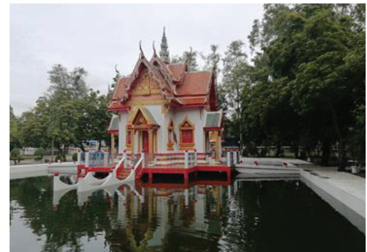
ภาพประกอบ 6 ศาสนสถานวัดป่าเทพเนรมิต