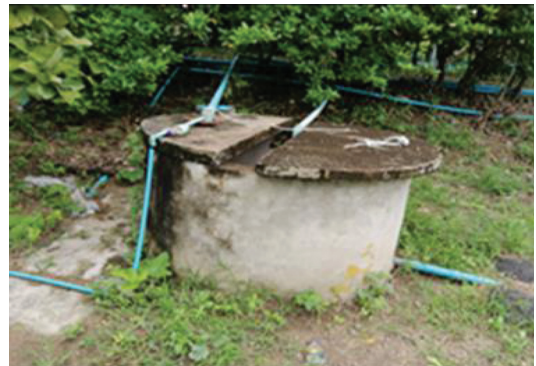
ภาพประกอบ 4 บ่อน้ำเก่าที่วัดถนนใหญ่

2) วัดถนนใหญ่ สร้างขึ้นตั้งแต่ปี พ.ศ. 2335 ในช่วงสมัยรัชกาลที่ 1 โดยการนำของครูบาสิงห์ วัดถนนใหญ่ มีพื้นที่เป็นเนินสูง ภายในบริเวณวัดมีโบราณสถานเก่าแก่ เป็นอุโบสถโบราณที่มีลักษณะแปลกกว่าอุโบสถอื่นๆ คืออุโบสถมหาอุดมภ์ เป็นโบสถ์ที่มีประตูเข้า-ออกทางเดียว สันนิษฐานว่าสร้างขึ้นมาในสมัยกรุงศรีอยุธยาตอนต้น เหตุที่มีทางเข้าออกเพียงทางเดียว เชื่อกันว่าเป็นสถานที่ไว้ทำพิธีกรรมในการลงของอาคมต่างๆ ที่ใช้ในการออกศึกสงคราม อุโบสถมีขนาดกว้าง 6 เมตร ยาว 15 เมตร สร้างเมื่อปี พ.ศ. 2338 ก่ออิฐก่อใหญ่ฉาบผนังด้วยปูน นอกจากนี้ ที่วัดถนนใหญ่ยังมีโบราณสถานที่สำคัญ ได้แก่ เสาหงส์ บ่อน้ำเก่าที่มีน้ำตลอดปี (สมาร์ท เอส เอ็ม อี, 2564)