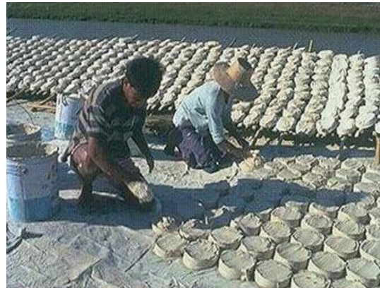
ภาพประกอบ 7 การทอผ้าและการทำดินสอพองของชาวถนนใหญ่