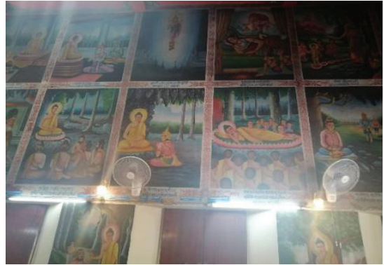
ภาพประกอบ 8 จิตรกรรมฝาผนังภายในอุโบสถวัดมงคลประสิทธิ์