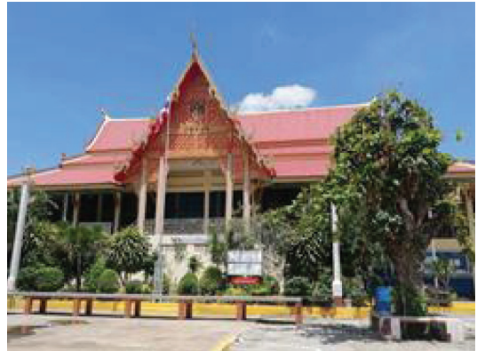
ภาพประกอบ 5 ศาสนสถานวัดถนนแค

4) วัดมงคลประสิทธิ์ (วัดถนนใหญ่นอก) ตั้งอยู่ที่หมู่ที่ 5 ตำบลถนนใหญ่ อำเภอเมือง จังหวัดลพบุรี มีพระเกจิที่มีชื่อเสียง คือ หลวงพ่อเพ็ง ถาวโร ท่านเป็นคนถนนใหญ่โดยกำเนิด เป็นพระปฏิบัติและมีวิชาอาคมแกร่งกล้าอยู่แนวหน้าในยุคหนึ่ง ท่านเป็นสหธรรมิกกับหลวงพ่อพรหม วัดช่องแค และยังเป็นอาจารย์ของหลวงพ่อโอด วัดจันเสน ด้วย (ณัฐพงศ์ พิมพาภรณ์, 2559)