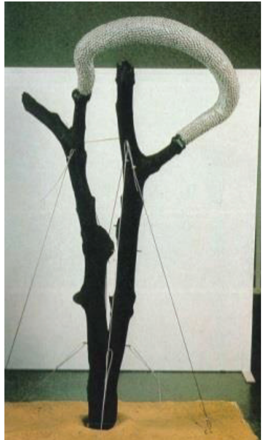
ภาพที่ 2 ผลงานธรรมชาติในสภาวะแวดล้อมปัจจุบัน (Natural Form in the Present Environment) พ.ศ. 2527

วัฒนธรรมเมืองหลวง หรือความเชื่อศรัทธาทางศาสนาเท่านั้น