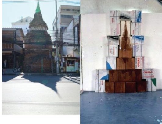
ภาพที่ 3 เจดีย์ในจังหวัดเชียงใหม่ราวพุทธศตวรรษ 2530 กับผลงานศิลปะสื่อผสม เจดีย์กล่องผงซักฟอก พ.ศ. 2533

2. การนำเสนอภาพแทนของท้องถิ่นผ่านผลงานสื่อผสมของมณฑิเรศ บุญมา สะท้อนการแสวงหาอัตลักษณ์ที่สอดคล้องกับปัจจัยเบื้องหลังการดำเนินชีวิต ถือเป็นรากฐานสำคัญของการสร้างสรรค์ เพราะศิลปินใช้โอกาสที่เป็นไปได้จากสังคมบริโภค อุตสาหกรรม ที่มอบตัวเลือกอันไม่จำกัด จากสินค้าอุปโภคบริโภค อุปกรณ์เทคโนโลยี มาสร้างสรรค์ผลงานที่แปลกตา มุ่งกระตุ้นความคิด ส่วนการลงไปค้นคว้า เพื่อเชื่อมโยงตนเองเข้ากับพื้นฐานของความเป็นอยู่อย่างใกล้ชิดด้วยตนเอง เปิดโอกาสให้ศิลปินเลือกใช้วัสดุที่หาง่ายรอบตัว หรือใกล้ชิดเป็นส่วนหนึ่งของสังคมไทย ผลงานจึงมีส่วนในการสื่อแทนสภาพสังคมและยุคสมัย เช่น การหายไปของโบราณสถาน การโยกย้ายแหล่งยึดเหนี่ยวทางจิตใจ