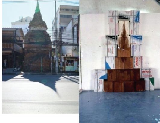
ภาพที่ 3 เจดีย์ในจังหวัดเชียงใหม่ราวพุทธศตวรรษ 2530 กับผลงานศิลปะสื่อผสมเจดีย์กล่องผงซึกฟอก พ.ศ. 2533

2. การนำเสนอภาพแทนของท้องถิ่นผ่านผลงานสื่อผสมของมณฑิเรศ บุญมา สะท้อนการแสวงหาอัตลักษณ์ที่สอดคล้องกับปัจจัยเบื้องหลังการดำเนินชีวิต ถือเป็นรากฐานสำคัญของการสร้างสรรค์ เพราะศิลปินใช้โอกาสที่เป็นไปได้จากสังคมบริโภคนิยม อุตสาหกรรม ที่มอบตัวเลือกอันไม่จำกัด จากสินค้าอุปโภคบริโภค อุปกรณ์เทคโนโลยี มาสร้างสรรค์ผลงานที่แปลกตา มุ่งกระตุ้นความคิด ส่วนการลงไปค้นคว้า เพื่อเชื่อมโยงตนเองเข้ากับพื้นฐานของความเป็นอยู่อย่างใกล้ชิดด้วยตนเอง เปิดโอกาสให้ศิลปินเลือกใช้วัสดุที่หาง่ายรอบตัว หรือใกล้ชิดเป็นส่วนหนึ่งของสังคมไทย ผลงานจึงมีส่วนในการสื่อแทนสภาพสังคมและยุคสมัย เช่น การหายไปของโบราณสถาน การโยกย้ายแหล่งยึดเหนี่ยวทางจิตใจ