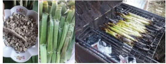
ภาพที่ 2: ขนมตดหมา

1.3.2 การแต่งกาย ในงานเทศกาลประเพณี ชาวบ้านธาตุน้อยทุกคนจะร่วมกันสวมใส่ชุดผ้าไหมที่ทอขึ้นในชุมชน โดยผู้หญิงสวมเสื้อไหมลายลูกแก้วสีดำ ปักชายเป็นลวดลายต่างๆ เฉวเรียงบ้างด้วยผ้าขาวม้าลายปลาไหล หรือลายตาหม่อง นุ่งผ้าซิ่นลวดลายเอกลักษณ์ของชุมชน เช่น ลายต้นสน ลายนาคคาบสน ลายปูนา ลายหมากจับ เป็นต้น ผู้ชายสวมเสื้อไหมลายลูกแก้วสีดำ ปักชายเป็นลวดลายต่างๆ และสวมผ้าโสร่งไหมที่ทอขึ้นโดยแม่บ้านของตนเอง และคาดเอวด้วยผ้าขาวม้าลายปลาไหลหรือลายตาหม่อง