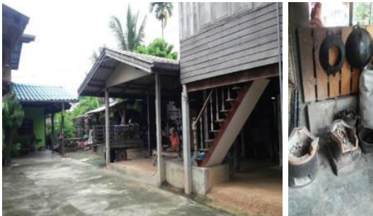
ภาพที่ 4 บ้านเรือนของชาวบ้านชาตุน้อย

1.3.3 บ้านเรือนและที่อยู่อาศัย ชาวบ้านชาตุน้อยนิยมสร้างบ้านด้วยไม้ โดยมากเป็นบ้าน 2 ชั้น มีเสา 9 ต้น ชั้นบนปิดมิดชิด เป็นพื้นที่สำหรับใช้เป็นห้องนอน ห้องเก็บของ ส่วนชั้นล่างเป็นได้ถุนสูงโปร่ง อากาศถ่ายเทสะดวก สำหรับใช้เป็นพื้นที่ในการทอผ้าและเก็บอุปกรณ์ต่างๆ ทุกหลังคาเรือนมีแคร่ไม้สำหรับนั่งกินข้าวและใช้ทำกิจกรรมทั่วไป