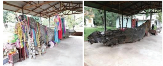
ภาพที่ 5 ต้นตะเคียนภายในบริเวณวัดบ้านชาตุน้อย

ในเขตบริเวณบ้านชาตุน้อยระหว่างการลอกลำน้ำ ผู้นำพร้อมด้วยชาวบ้านจึงได้นำมาเก็บรักษาไว้ในวัดบ้านชาตุน้อย จากนั้นมีการสร้างหลังคาครอบไว้เพื่อป้องกันแดดและฝน โดยได้รับการบริจาคจากเหล่านักพนันเขียนหวยที่เดินทางมาขอโชค และได้ประสบผลสำเร็จ