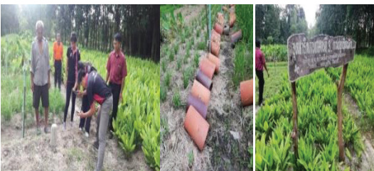
ภาพที่ 7 จุดสาธิตการทำผักแป้นขาว

การทำเกษตรแบบผสมผสานเป็นอาชีพเสริมของชาวบ้านธาตุน้อย โดยมีการปลูกพืชผักหลายชนิด เช่น พริก กุยช่าย มัน เผือก ดอกกระเจียว ข่า ตะไคร้ มะละกอ เป็นต้น ผักที่นิยมและเป็นที่ต้องการของตลาดคือ กุยช่ายขาว (ผักแป้นขาว) เป็นพืชผักที่อยู่ในตระกูลเดียวกับหอมกระเทียม กุยช่ายขาวสามารถนำมาประกอบอาหารได้หลายชนิด เพราะเป็นผักที่มีความกรอบ ความหวานเพิ่มขึ้น รสชาติดีขึ้นกว่าใบสีเขียวธรรมดา กุยช่ายขาว จึงขายได้ราคาดีกว่าและเป็นที่ยอมรับประทานมากกว่ากุยช่ายเขียว เทคนิคการดูแลจัดการให้ต้นกุยช่ายเปลี่ยนสีใบจากสีเขียวเป็นสีขาว โดยใช้กระถางครอบกอกุยช่ายไว้เพื่อไม่ให้ได้รับแสงจากพระอาทิตย์