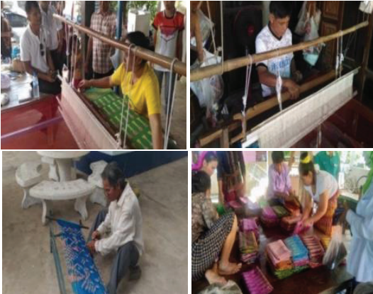
ภาพที่ 6 ชาวบ้านทุกเพศทุกวัยมีส่วนร่วม ในการทอผ้าไหม

การทำเกษตรแบบผสมผสานเป็นอาชีพเสริมของชาวบ้านธาตุน้อย โดยมีการปลูกพืชผักหลายชนิด เช่น พริก กุยช่าย มัน เผือก ดอกกระเจียว ข่า ตะไคร้ มะละกอ เป็นต้น ผักที่นิยมและเป็นที่ต้องการของตลาดคือ กุยช่ายขาว (ผักแป้นขาว) เป็นพืชผักที่อยู่ในตระกูลเดียวกับหอมกระเทียม กุยช่ายขาวสามารถนำมาประกอบอาหารได้หลายชนิด เพราะเป็นผักที่มีความกรอบ ความหวานเพิ่มขึ้น รสชาติดีขึ้นกว่าใบสีเขียวธรรมดา กุยช่ายขาว จึงขายได้ราคาดีกว่าและเป็นที่ยอมรับประทานมากกว่ากุยช่ายเขียว เทคนิคการดูแลจัดการให้ต้นกุยช่ายเปลี่ยนสีใบจากสีเขียวเป็นสีขาว โดยใช้กระถางครอบกอกุยช่ายไว้เพื่อไม่ให้ได้รับแสงจากพระอาทิตย์