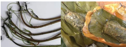
ภาพที่ 1: ห่อหมกยอดเขียง

1.3.1 อาหารพื้นบ้าน ได้แก่ ห่อหมก ยอดเขียง แกงขี้เหล็กใส่ดกแด่ แกงไก่ใส่หยวกกล้วย และขนมพื้นบ้าน ได้แก่ ขนมเทียนตาล และขนมตดหมา