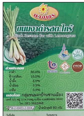
(ภาพขวา: ฉลากผลิตภัณฑ์ขนมงา)

ภาพประกอบ 2 การจัดวางองค์ประกอบข้อความบนฉลากผลิตภัณฑ์ระดับ 3-5 ดาว