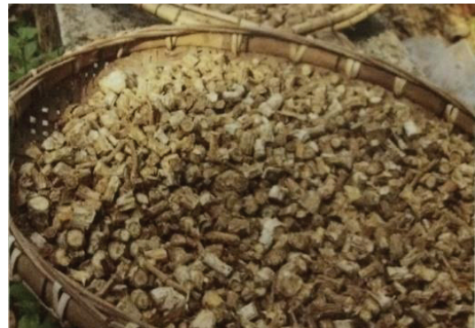
ภาพประกอบ 5 ตัวอย่างสมุนไพร

พื้นบ้านการอนุรักษ์ไว้ซึ่งภูมิปัญญาไทยในการใช้พืชพื้นบ้านรักษาโรค และรักษาวัฒนธรรมพื้นบ้านตามวิถีการแบบดั้งเดิม ในสวนสมุนไพรมีสมุนไพรประเภทต่างๆ กว่า 5,000 ชนิด ซึ่งปลูกไว้ในถุเพาะชำ ในกระถาง ในล้อยาง และในดิน จึงทำให้สวนสมุนไพรแห่งนี้เป็นศูนย์กลางในเรียนรู้เรื่องพืชสมุนไพรให้แก่นักเรียน นักศึกษา เกษตรกร และผู้ที่มีความสนใจ อีกทั้งยังมีตำรารักษาโรคด้วยสมุนไพรพื้นบ้านมากกว่า 50 เล่ม เพื่อการเรียนรู้สำหรับแพทย์แผนไทย และการรักษาผู้ป่วยด้วยยาต้ม เช่น การรักษาตับอักเสบ-ดีซ่าน อากาศปวดเมื่อยบริเวณหลัง ปวดเข่า ปวดสะโพก เจ็บสันเท้า อันเป็นสาเหตุ เนื่องจากไขมันอุดตันเส้นเลือด เป็นต้น รายละเอียดแสดงดังภาพประกอบ 5