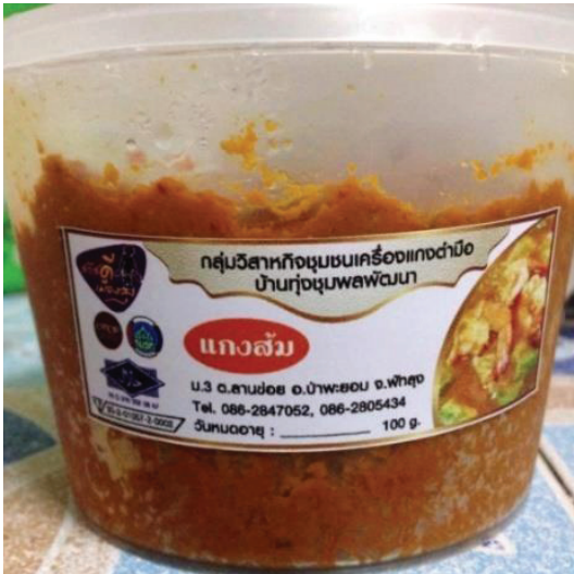
ภาพประกอบ 4 ผลิตภัณฑ์เครื่องแกงลานข่อย