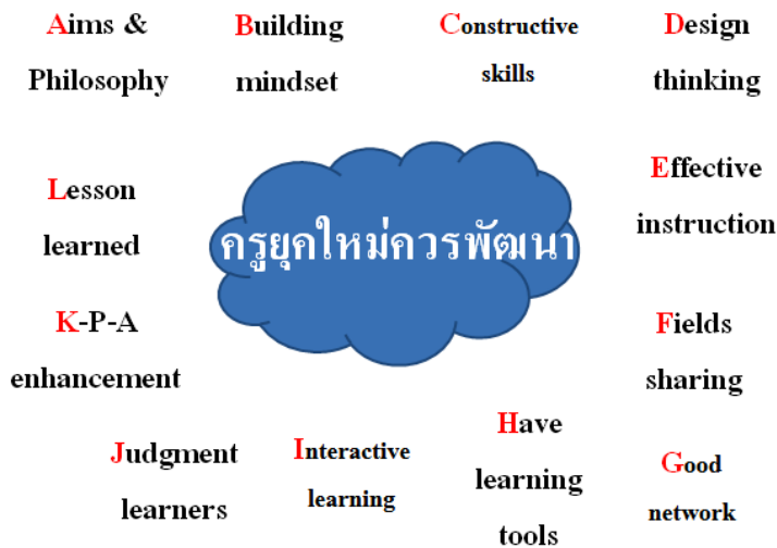
ภาพที่ 3 แนวคิดการพัฒนาตนเองของครู

การพัฒนาลักษณะดังกล่าวข้างต้น ครูควรเชื่อมโยงทั้งความรู้ ทักษะ และคุณลักษณะอันพึงประสงค์โดยต้องปรับความคิดเสียใหม่ว่าการเป็นครูยุคศตวรรษที่ 21 ต้องเรียนรู้และพัฒนาตนเองมากกว่าอดีต เนื่องจากความรู้มีมหาศาลและหลากหลายวิธีการ ผู้เขียนจึงนำเสนอแนวทางการพัฒนาตนเองของครูในศตวรรษที่ 21 ว่าต้องปรับเปลี่ยนทั้งวิธีคิด วิธีปฏิบัติ ประเมินตนเอง และปรับปรุงต่อยอด ดังนี้