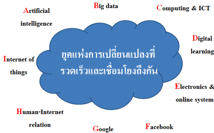
ภาพที่ 1 การเปลี่ยนแปลงทางเทคโนโลยีสารสนเทศ

others, 2018) แนะนำแหล่งเรียนรู้ที่น่าเชื่อถือและเป็นประโยชน์ต่อการสร้างเสริมเติมต่อความรู้ แหล่งเรียนรู้นั้นอาจเป็นทั้งออนไลน์และเทคโนโลยีที่ช่วยให้เกิดการเรียนรู้ได้ง่าย สามารถนำมาบูรณาการและปรับใช้ในการดำรงชีวิต การทำงาน และการสื่อสารอย่างมีประสิทธิภาพ (ภาพที่ 1)