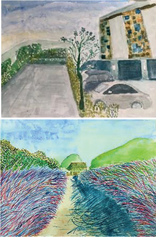
ผลงานความก้าวหน้าของผู้เรียนที่มีผลคะแนนต่ำที่สุด