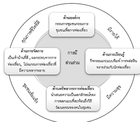
ภาพที่ 2 รูปแบบการพัฒนาศักยภาพการท่องเที่ยวชุมชนบ้านหนองโสน

โดยมีกิจกรรมด้านการเรียนรู้การหล่อหินทรายร่วมไปกับการท่องเที่ยว โดยชาวชุมชนได้นำกิจกรรมการแกะแบบพิมพ์และหล่อหินทรายอย่างง่ายเพื่อให้ผู้มาเยือนได้ศึกษาอย่างลึกซึ้งบรรจุไว้ในโปรแกรมการท่องเที่ยว เพื่อให้นักท่องเที่ยวเกิดความประทับใจและเกิดการเรียนรู้ประสบการณ์ใหม่ๆ และทำให้รับรู้ถึงวัฒนธรรมวิถีชีวิตของชาวหนองโสน 3) ด้านทรัพยากรการท่องเที่ยวชุมชน นั้น ชาวบ้านมุ่งนำเสนอความเป็นเอกลักษณ์ของการออกแบบแม่พิมพ์หล่อหินทรายที่มีความสวยงาม ประณีต และหลากหลายตรงตามความต้องการผู้ซื้อ มุ่งเน้นการสื่อสารให้นักท่องเที่ยวเข้าใจในวิถีชุมชนหล่อหินทรายด้วยการนำผลิตภัณฑ์ท้องถิ่นที่สะท้อนถึงวิถีวัฒนธรรมของคนในชุมชนออกจำหน่ายด้วยตนเอง และ 4) ด้านการจัดการ ชาวชุมชนบ้านหนองโสนนอกจากจะจัดให้มีคณะกรรมการชุมชนเพื่อการท่องเที่ยวและมีการกระจายผลประโยชน์แก่ชุมชนอย่างเป็นธรรมแล้ว ชุมชนยังร่วมกันพัฒนากิจกรรมการท่องเที่ยวที่คำนึงถึงผลกระทบต่อสิ่งแวดล้อม และมีการออกแบบโปรแกรมการท่องเที่ยวที่มีความหลากหลายรวมไว้ในโปรแกรมการท่องเที่ยวมีตัวแทนชุมชนคอยให้ความรู้และนำข้อมูลต่างๆ ในการท่องเที่ยวรวมทั้งชุมชนยังร่วมมือกันเป็นเจ้าบ้านที่ดีในการต้อนรับนักท่องเที่ยวผู้มาเยือนอีกด้วย