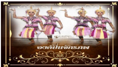
ภาพประกอบที่ 11 ท่าองค์ปั้นจักรภพ

ทำรำนโหราห์ที่มีความสัมพันธ์กับการทรงตัวและความแข็งแรงของร่างกายนั้น ในส่วนนี้จะฝึกความพร้อมของร่างกาย ตั้งแต่ การตัดขา ตัดหลัง ฝึกยืนทรงตัวขาเดียว เพื่อให้กล้ามเนื้อและข้อต่อต่าง ๆ เคลื่อนไหวยืดตัวและแข็งแรงเพิ่มมากขึ้นถ้าผู้รำฝึกฝนอย่างสม่ำเสมอ จะทำให้การจัดร่างกายอวัยวะต่าง ๆ มีประสิทธิภาพและมีความสวยงามซึ่งทำรำที่มีความสัมพันธ์กับการทรงตัวและความแข็งแรง ได้แก่ ท่าองค์ปั้นจักรภพ, ท่าพระเสด็จ, ท่าสถิตห้วงเวหน, ท่าพิมาน, ท่าปิ่นไอศูรย์, และท่าสรวง ตามคำสัมภาษณ์ของผู้ให้ข้อมูลและมีรูปแบบท่ารำประกอบดังรูปภาพประกอบที่ 11-16