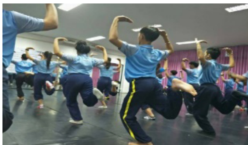
ภาพประกอบที่ 6 การฝึกยืน