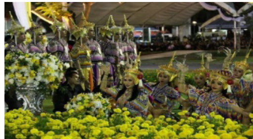
ภาพประกอบที่ 19 กระบวนกรำช่วงที่ 3

กระบวนกรำช่วงที่ 3 เป็นการรำเพลงทับเพลงโทน มีการรำพร้องที่มีประพันธ์ในรูปแบบกลอนแปดและหกจำนวน 1 บท เพื่อนำมาตีทำรำประกอบในจังหวะ ซึ่งได้มีการออกแบบท่ารำประกอบ 4 รูปแบบ โดยใช้การรำต่อเนื่องและสลับกันทั้งสามรูปแบบ เพื่อรำยาวอ่อนช้อยสวยงามตลอดระยะเวลาการแสดง