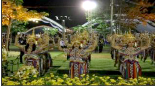
ภาพประกอบที่ 17 กระบวนกรำช่วงที่ 1

กระบวนกรำช่วงที่ 1 เป็นการรำประสมท่าหรือการรำเพลงโค โดยนำท่ารำพื้นฐานมาดัดแปลง ผู้รำต้องมีพื้นฐานความอ่อนตัวของอวัยวะทุกส่วนของร่างกายเพื่อตัดหรือจัดรูปทรงได้ตามต้องการ