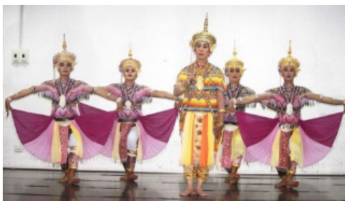
ภาพประกอบที่ 8 ท่าแมงมุมชักใย

จากภาพประกอบที่ 7 ท่ากின்றน้อยหรือท่าชี้หนอน เป็นการฝึกกล้ามเนื้อแขนและกล้ามเนื้อขา ให้กล้ามเนื้อยืดหยุ่นเพิ่มขึ้น ผู้รำต้องมีลักษณะตัวอ่อนและการทรงตัวที่ดีที่ผ่านการฝึกฝนร่างกายมาเป็นระยะเวลาานาน ซึ่งแต่ละคนจะมีทักษะหรือศักยภาพแตกต่างกัน