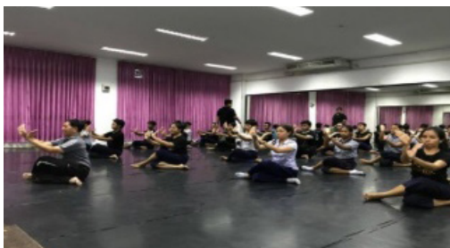
ภาพประกอบที่ 1 การฝึกหัดตัดข้อมือ