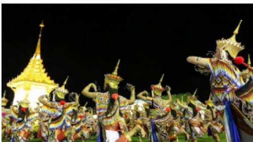
ภาพประกอบที่ 18 กระบวนกรำช่วงที่ 2

กระบวนกรำช่วงที่ 2 เป็นการรำผืนหน้าหรือ การทำกำพืด มีการนำพร้องที่มีการประพันธ์ขึ้นมาใหม่ ในรูปแบบกลอนสี่มาขับร้อง และนำมาตีทำรำประกอบจังหวะผืนหน้า ผู้รำต้องมีทักษะการทรงตัว และการเคลื่อนไหวร่างกายที่ตามจังหวะในการร้องเพลงประกอบ เพื่อความไพเราะและให้ตีทำรำสวยงามเหมาะสมกับงานพระราชพิธีสงฆ์