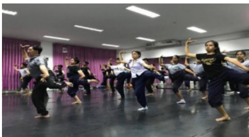
ภาพประกอบที่ 3 การฝึกทรงตัว