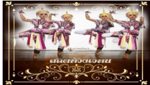
ภาพประกอบที่ 13 ท่าสถิตห้วงเวหน

จากภาพประกอบที่ 12 ท่าพระเสด็จ ผู้รำจะต้องฝึกการย่อตัวและย่อเข่า ให้กล้ามเนื้อขาเกิดการคลายตัวและยืดหยุ่นแข็งแรงเพิ่มขึ้น