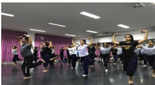
ภาพประกอบที่ 4 การฝึกทรงตัว