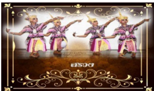
ภาพประกอบที่ 16 ทำสถิตห้วงเวหน

จากภาพประกอบที่ 15 ทำปิ่นไอศูรย์ เป็นการรำประสม ต้องมีพื้นฐานการทรงตัวตั้งแต่ช่วงลำตัว จะต้องแอ่นอกอยู่เสมอ