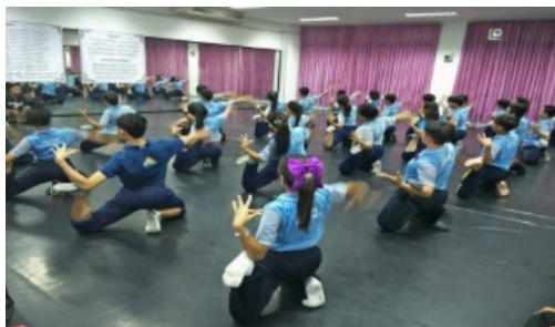
ภาพประกอบที่ 5 การฝึกงอตัว ที่มา: กองทอง ชีระวร