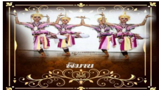
ภาพประกอบที่ 14 ท่าพิมาน

จากภาพประกอบที่ 13 ท่าสถิตห้วงเวหน ฝึกกล้ามเนื้อขาให้แข็งแรง สามารถรำได้อย่างสมดุล และเมื่ออวัยวะอ่อนตัวจะทำให้หักหรืองอตามรูปแบบที่ต้องการได้