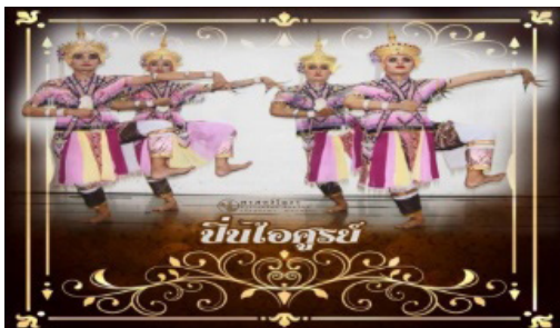
ภาพประกอบที่ 15 ทำปิ่นไอศูรย์

จากภาพประกอบที่ 15 ทำปิ่นไอศูรย์ เป็นการรำประสม ต้องมีพื้นฐานการทรงตัวตั้งแต่ช่วงลำตัว จะต้องแอ่นอกอยู่เสมอ