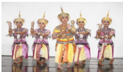
ภาพประกอบที่ 9 ท่าทำนองเทวดา

จากภาพประกอบที่ 8 ท่าแมงมุมชักใย เป็นการฝึกดัดแขนและข้อมือ ให้อ่อนโค้งและกล้ามเนื้อขยายตัวมากกว่าปกติ และทำให้กระดูกข้อมือสามารถหักหรือพับเข้าหาตัวเองอย่างอ่อนช้อยสวยงาม