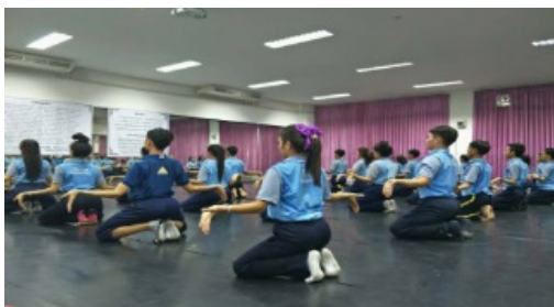
ภาพประกอบที่ 2 การฝึกหัดตัดแขน