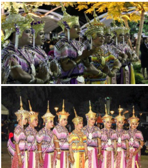
ภาพประกอบที่ 20 กระบวนการรำช่วงสุดท้าย

กระบวนการรำช่วงสุดท้าย เป็นกระบวนการรำพิเศษ เฉพาะโนราใหญ่ จำนวน 9 คน เป็นกระบวนการรำที่มีลักษณะเฉพาะเป็นเอกลักษณ์ เพื่อให้ผู้รำอวดทักษะความสามารถ เฉพาะบุคคลซึ่งจะต้องผ่านการฝึกฝนและมีทักษะพิเศษ โดยผู้รำทั้ง 9 คนรำรำผ่านลีลาที่งดงาม เพื่อรำถวายส่งเสด็จเป็นครั้งสุดท้าย