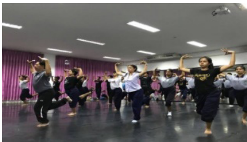
ภาพประกอบที่ 7 ท่ากின்றน้อยหรือ ท่าชี้หนอน

จากภาพประกอบที่ 7 ท่ากின்றน้อยหรือท่าชี้หนอน เป็นการฝึกกล้ามเนื้อแขนและกล้ามเนื้อขา ให้กล้ามเนื้อยืดหยุ่นเพิ่มขึ้น ผู้รำต้องมีลักษณะตัวอ่อนและการทรงตัวที่ดีที่ผ่านการฝึกฝนร่างกายมาเป็นระยะเวลาานาน ซึ่งแต่ละคนจะมีทักษะหรือศักยภาพแตกต่างกัน