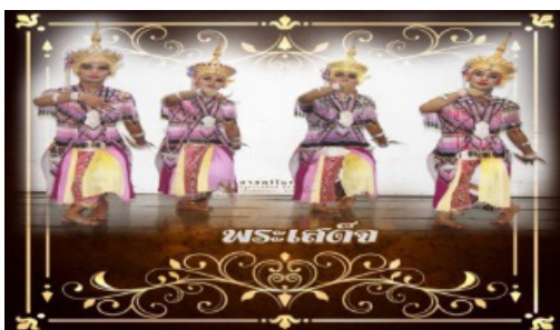
ภาพประกอบที่ 12 ท่าพระเสด็จ

จากภาพประกอบที่ 11 ท่าองค์ปั้นจักรภพ ผู้รำจะต้องฝึก การทรงให้กล้ามเนื้อขาแข็งแรง เพื่อให้ทรงตัวได้เป็นระยะเวลานาน