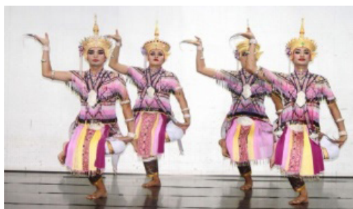
ภาพประกอบที่ 10 ท่าพระสุริยวงศ์ทรงศักดิ์ (ประยุกต์)

จากภาพประกอบที่ 9 ท่าทำนองเทวดา เป็นการฝึกกล้ามเนื้อแขนและกล้ามเนื้อขา เพื่อให้กล้ามเนื้อคลายตัวมีความยืดหยุ่นและ ทำให้กล้ามเนื้อขามีพลังแข็งแรงเพิ่มขึ้น สามารถพับกระดูกหรือจัดวางในตำแหน่งที่ต้องการได้