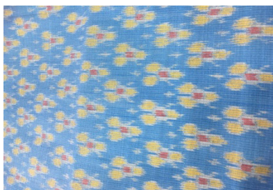
ภาพที่ 2 ผ้าทอลายดอกกลาดวน

3. ถ่ายทอดองค์ความรู้ โดยการจัดอบรมเชิงปฏิบัติการเกี่ยวกับการทอผ้าเหยียบผสมลายดอกกลาดวนเทคนิคมัดหมี่แก่กลุ่มทอผ้าในจังหวัดศรีสะเกษ จำนวน 30 คน ซึ่งมีวิธีการทอ 8 ขั้นตอน คือ 1) การฟอกเส้นไหม 2) การคันหมี่ 3) การมัดหมี่ 4) การย้อมสี 5) การแก้มือหมี่ 6) การปั่นหลอด 7) การร้อยไหม 8) การทอผ้า ซึ่ง พบว่า กระบวนการถ่ายทอดองค์ความรู้การทอผ้าลายดอกกลาดวนโดยรวมมีระดับมาก โดยเรียงลำดับจากมากคือ ผู้เชี่ยวชาญมีเทคนิค/วิธีการเล่าและถ่ายทอดองค์ความรู้ใหม่อย่างน่าสนใจ ( \bar{X} = 4.27 , S.D = 0.62) รองลงมาด้านวิทยากร / ผู้เชี่ยวชาญ ความรู้ความสามารถในเรื่องการทอผ้าของผู้เชี่ยวชาญ ( \bar{X} = 4.23 , S.D = 0.71) น้อยที่สุด ความเหมาะสมของขั้นตอนในการรวบรวมองค์ความรู้ให้เป็นระบบ ( \bar{X} = 3.93 , S.D = 0.64) และมีความพึงพอใจที่มีต่อลายดอกกลาดวน โดยการจัดนิทรรศการเผยแพร่ผลงานแก่กลุ่มทอผ้าและผู้เข้าร่วมชม จำนวน 100 คน พบว่าระดับความคิดเห็นเกี่ยวกับการเข้าชมนิทรรศการรวมทุกด้านโดยรวมอยู่ในระดับ มาก โดยด้านที่มีค่าเฉลี่ยมากที่สุดคือด้านเอกสารเผยแพร่ความรู้ สถานที่ ( \bar{X} = 4.65 , S.D = 0.68) มี รองลงมาคือเฉลี่ยมากที่สุดคือด้านความสะดวก ( \bar{X} = 4.61 , S.D = 0.64) และภาพรวม/รูปแบบการจัดนิทรรศการสะดวก ( \bar{X} = 4.60 , S.D = 0.63) ตามลำดับ นำเสนอต่อภาพที่ 3