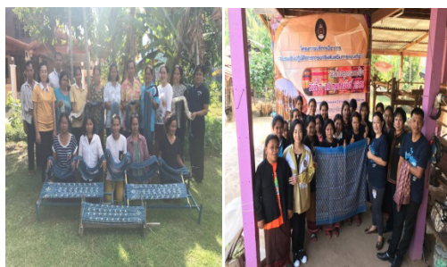
ภาพที่ 3 ถ่ายทอดองค์ความรู้แก่ชุมชน

3. ถ่ายทอดองค์ความรู้ โดยการจัดอบรมเชิงปฏิบัติการเกี่ยวกับการทอผ้าเหยียบผสมลายดอกกลาดวนเทคนิคมัดหมี่แก่กลุ่มทอผ้าในจังหวัดศรีสะเกษ จำนวน 30 คน ซึ่งมีวิธีการทอ 8 ขั้นตอน คือ 1) การฟอกเส้นไหม 2) การคันหมี่ 3) การมัดหมี่ 4) การย้อมสี 5) การแก้มือหมี่ 6) การปั่นหลอด 7) การร้อยไหม 8) การทอผ้า ซึ่ง พบว่า กระบวนการถ่ายทอดองค์ความรู้การทอผ้าลายดอกกลาดวนโดยรวมมีระดับมาก โดยเรียงลำดับจากมากคือ ผู้เชี่ยวชาญมีเทคนิค/วิธีการเล่าและถ่ายทอดองค์ความรู้ใหม่อย่างน่าสนใจ ( \bar{X} = 4.27 , S.D = 0.62) รองลงมาด้านวิทยากร / ผู้เชี่ยวชาญ ความรู้ความสามารถในเรื่องการทอผ้าของผู้เชี่ยวชาญ ( \bar{X} = 4.23 , S.D = 0.71) น้อยที่สุด ความเหมาะสมของขั้นตอนในการรวบรวมองค์ความรู้ให้เป็นระบบ ( \bar{X} = 3.93 , S.D = 0.64) และมีความพึงพอใจที่มีต่อลายดอกกลาดวน โดยการจัดนิทรรศการเผยแพร่ผลงานแก่กลุ่มทอผ้าและผู้เข้าร่วมชม จำนวน 100 คน พบว่าระดับความคิดเห็นเกี่ยวกับการเข้าชมนิทรรศการรวมทุกด้านโดยรวมอยู่ในระดับ มาก โดยด้านที่มีค่าเฉลี่ยมากที่สุดคือด้านเอกสารเผยแพร่ความรู้ สถานที่ ( \bar{X} = 4.65 , S.D = 0.68) มี รองลงมาคือเฉลี่ยมากที่สุดคือด้านความสะดวก ( \bar{X} = 4.61 , S.D = 0.64) และภาพรวม/รูปแบบการจัดนิทรรศการสะดวก ( \bar{X} = 4.60 , S.D = 0.63) ตามลำดับ นำเสนอต่อภาพที่ 3