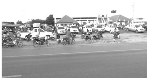
ภาพประกอบ 1 ที่ตั้งตลาดนัดตอนเริ่มขาย

interview) การสังเกตแบบไม่มีส่วนร่วม (Non-Participant Observation) จากการทบทวนวรรณกรรม ทฤษฎีและงานวิจัยที่ผ่านมา (Literature Review) มาวิเคราะห์ด้านต่างๆ ตามวัตถุประสงค์ของการศึกษาอธิบายแบบพรรณนาวิเคราะห์ (Descriptive Analysis)ตลอดจนนโยบายที่เกี่ยวข้อง สรุปตามประเด็นที่ศึกษา