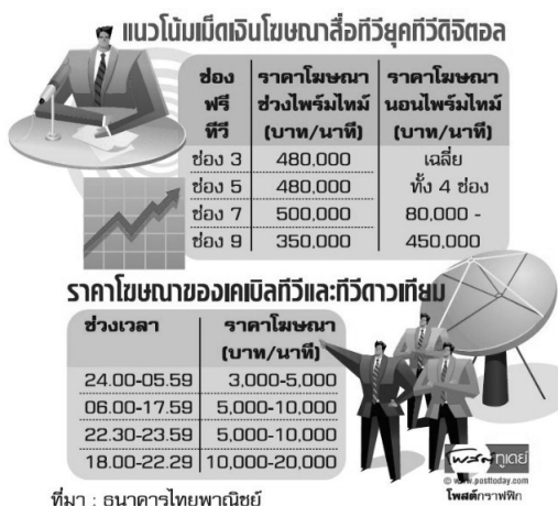
ภาพที่ 2 แสดงแนวโน้มค่าโฆษณาสื่อโทรทัศน์ในยุคทีวีดิจิทัล