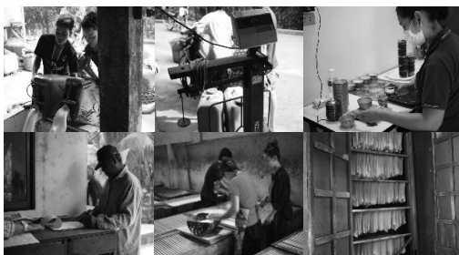
ภาพที่ 1-6 กระบวนการผลิตยางแผ่นรมควันของสหกรณ์บ้านหุแร่ จำกัด ที่มา : ถ่ายภาพโดยผู้วิจัย เมื่อวันที่ 1 กรกฎาคม 2559

ส่งเสริมสหกรณ์เข้ามาให้ความรู้และแนวทางเกี่ยวกับการทำยางแผ่นรมควัน รวมถึงวิธีการบริหารจัดการสหกรณ์ เพื่อจัดตั้งสหกรณ์กองทุนสวนยางให้เกิดขึ้นในชุมชนตามนโยบายของรัฐ โดยมีวัตถุประสงค์ให้เกษตรกรชาวสวนยางในชุมชนทราบถึงประโยชน์ของสหกรณ์และเป็นศูนย์เรียนรู้ของคนในชุมชน มีการจัดตั้งคณะกรรมการเพื่อเป็นผู้ควบคุมดูแลการดำเนินงานต่าง ๆ ของสหกรณ์ในการดำเนินการจัดตั้งโรงเรียนนั้น เงินทุนส่วนหนึ่งมาจากนโยบายของรัฐ และอีกส่วนมาจากการลงหุ้นของสมาชิกสหกรณ์ เพื่อให้เกิดการหมุนเวียนเงินในการปันผลและจัดสรรเป็นสวัสดิการแก่สมาชิกสหกรณ์ต่อไป (ภาพที่ 1-6)