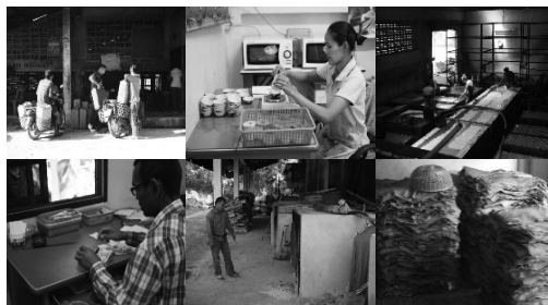
ภาพที่ 7-12 กระบวนการผลิตยางแผ่นรมควันของสหกรณ์บ้านพुरुษาพัฒนา จำกัด ที่มา : ถ่ายภาพโดยผู้วิจัย เมื่อวันที่ 1 กรกฎาคม 2559

ได้มีการจัดสวัสดิการในด้านต่าง ๆ และมีการคืนเงินปันผลแก่สมาชิกสหกรณ์เป็นประจำทุกปีอีกด้วย (ภาพที่ 7-12)