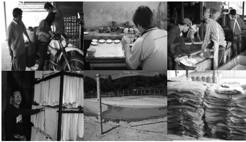
ภาพที่ 13-18 กระบวนการผลิตยางแผ่นรมควันของสหกรณ์บ้านวังพา จำกัด