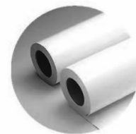
สติ๊กเกอร์ สีกรมท่า / สีขาว

ภาพที่ 3 วัสดุสำหรับการออกแบบระบบป้ายสัญลักษณ์จากข้อเสนอแนะของคณะผู้บริหาร