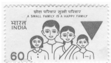
ภาพประกอบ 2 การรณรงค์การวางแผนครอบครัวบนแสตมป์เป็นรูปครอบครัวที่มีความสุขและสัญลักษณ์สามเหลี่ยมที่สื่อถึงการลดขนาดครอบครัว