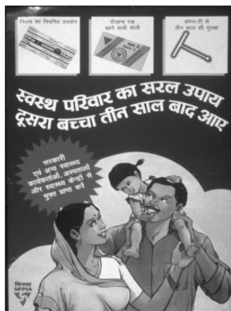
ภาพประกอบ 3 ป้ายรณรงค์การวางแผนครอบครัวโดยให้คู่สมรสเว้นระยะการมีบุตรคนที่สองออกไป 3 ปีหลังจากมีบุตรคนแรก