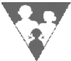
ภาพประกอบ 1 สัญลักษณ์แห่งการวางแผนครอบครัว