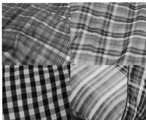
ภาพประกอบ 1 ผ้าขาวม้าลายริ้วเล็ก หรือลายตารางเล็กของกลุ่มทอผ้าบ้านหนองแคน หมู่ 4 ตำบลเหล่า อำเภอกุสุมาลย์ จังหวัดมหาสารคาม ที่มา : ภาพถ่าย วันที่ 6 เมษายน 2557