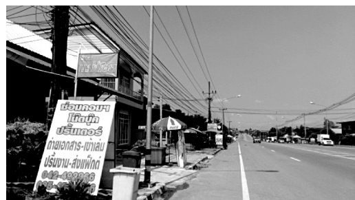
ภาพประกอบ 4 โครงสร้างแบบชุมชนเมือง

1) โครงสร้างเมืองแบบชุมชนชนบทเป็นรูปแบบของการตั้งถิ่นฐานของชุมชนบึงกาฬในอดีตมีการกระจายตัวกลุ่มชุมชนยึดเกาะตามแนวแม่น้ำ คือ จะเลือกพื้นที่ที่มีลักษณะในระยะไม่ไกลจากน้ำ พื้นที่ที่จะตั้งถิ่นฐานต้องมีพื้นที่เพียงพอสำหรับการทำเกษตรเช่นปลูกข้าวปลูกพืชสวนพืชไร่อื่น ๆ เนื่องจากในอดีตชุมชนบึงกาฬมีการใช้แม่น้ำเพื่อการคมนาคมขนส่งมีความเกี่ยวข้องกับวัฒนธรรมและวิถีชีวิตที่เกี่ยวกับสายน้ำที่สามารถนำมาใช้ประโยชน์ต่อการดำรงชีพของประชาชนหลากหลายรูปแบบ