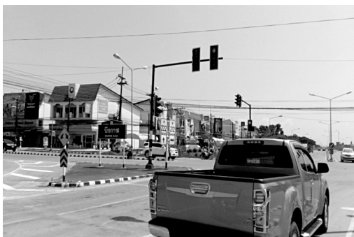
ภาพประกอบ 1 อาคารพาณิชย์กรรมพื้นที่เพื่อการอยู่อาศัย อุตสาหกรรม และสิ่งปลูกสร้างอื่น

ประชากรทุกระดับรายได้มีระบบการตัดสินใจในการพัฒนาชุมชนที่คาดการณ์ได้ชัดเจน ยุติธรรม และมีประสิทธิภาพด้านต้นทุน การสนับสนุนการมีส่วนร่วมของชุมชนและส่งเสริมประสานร่วมมือกันระหว่างชุมชนและผู้มีส่วนได้ส่วนเสีย และมีการรักษาที่โล่งพื้นที่การเกษตรพื้นที่ที่ธรรมชาติที่งดงามพื้นที่อนุรักษ์ประวัติศาสตร์และพื้นที่ซึ่งมีความเสี่ยงด้านสิ่งแวดล้อมดังแสดงในตาราง 3