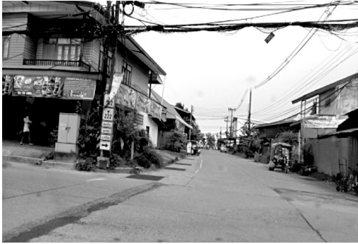
ภาพประกอบ 2 ชุมชนแออัดในเขตชุมชนบึงกาฬ

ดังนั้น ประชาชนจึงมีความคิดเห็นสอดคล้องกันว่า พื้นที่ที่เหมาะสมสำหรับการตั้งถิ่นฐานของชุมชนบึงกาฬนั้น ควรมีการใช้ประโยชน์ที่ดินแบบผสมผสานและหลากหลาย โดยเฉพาะการใช้ประโยชน์ที่ดินในด้านการเกษตร เพราะประชาชนส่วนใหญ่ประกอบอาชีพทางด้านเกษตรกรรม มีพื้นที่ถือครองทางการเกษตร และมีความหลากหลายทางธรรมชาติที่สามารถนำมาดำรงชีพประจำวันได้เป็นอย่างดี และการใช้ประโยชน์ที่ดินในด้านการท่องเที่ยว เนื่องจากชุมชนบึงกาฬมีภูมิทัศน์ทางธรรมชาติที่สวยงาม และควรพัฒนาด้านการคมนาคม ด้านสาธารณสุข และด้านธุรกิจ เช่น ขยายผิวจราจร การเชื่อมต่อเส้นทางในการเดินทาง/การขนส่ง การพัฒนาโครงสร้างพื้นฐาน เช่น พัฒนาริมตลิ่ง มีการทำคันดินสไลด์กันน้ำเซาะ การพัฒนาการท่องเที่ยวเชิงเกษตร การพัฒนาที่ดินทำกิน เป็นต้น