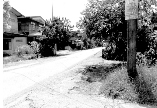
ภาพประกอบ 3 โครงสร้างแบบชุมชนชนบท

กำหนดชั้นข้อมูลสำหรับการวิเคราะห์พื้นที่ที่เหมาะสมสำหรับการตั้งถิ่นฐานเพื่อการเติบโตอย่างชาญฉลาดที่เน้นการวิเคราะห์พื้นที่ที่เป็นสิ่งแวดล้อมที่มนุษย์สร้างขึ้น สิ่งแวดล้อมตามธรรมชาติและและปัจจัยด้านเศรษฐกิจของ Daniels, Tom and Daniels (2010) กล่าวคือ