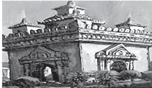
ชื่อภาพ “ประตูชัยสัญลักษณ์แห่งเวียงจันทน์” สื่อวัสดุ สีน้ำมัน ขนาด 80x60 เซนติเมตร ผลงาน สร้างที่ประเทศไทย พ.ศ. 2558