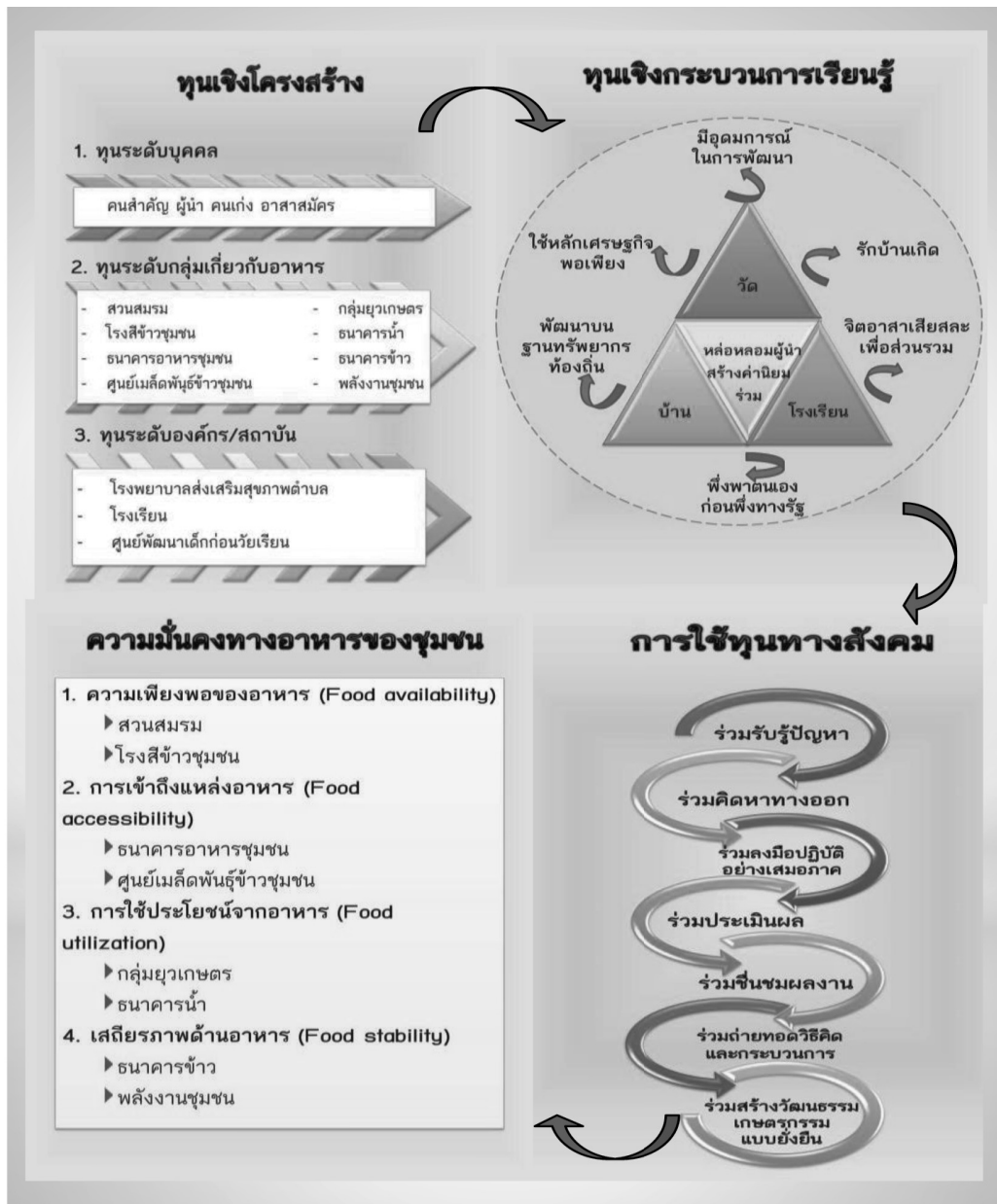
แผนภาพที่ 2 การนำใช้ทุนทางสังคมเพื่อพัฒนาสู่ความมั่นคงทางอาหาร ของชุมชน ตำบลควนรู อำเภอรัตภูมิ จังหวัดสงขลา