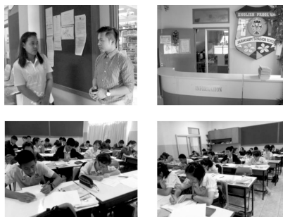
ภาพประกอบ 2 การสัมภาษณ์แบบสังเกตและการสนทนากลุ่ม

โดยผู้ศึกษาเก็บข้อมูลภาคสนามเมื่อ วันพฤหัสบดี ที่ 4 ธันวาคม พ.ศ. 2557 ณ ห้องเรียน English Program โรงเรียนสารคามพิทยาคมอำเภอเมือง จังหวัดมหาสารคามแสดงดังภาพที่ 2