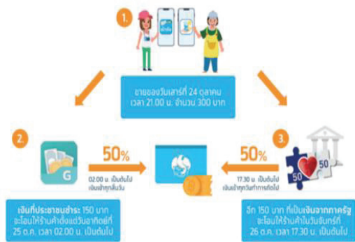
ภาพที่ 2 แสดงเวลาและสัดส่วนเงินโอนเข้าบัญชีร้านค้าคนละครึ่ง

จากข้อมูลดังกล่าวจะเห็นได้ว่าธุรกิจร้านค้าที่เข้าร่วมโครงการคนละครึ่ง จะมีรายได้จากการเข้าร่วมโครงการ แต่จะได้รับเงินแบ่งออกเป็น 2 ส่วน ส่วนแรกจากประชาชนจำนวน ร้อยละ 50 ในตอนสิ้นวัน และส่วนที่สองจากรัฐบาล ร้อยละ 50 จะได้รับในวันทำการถัดไป ซึ่งอาจส่งผลให้ร้านค้าขาดสภาพคล่องได้ ทั้งนี้ การบริหารเงินทุนหมุนเวียนเป็นสิ่งจำเป็นของร้านค้า โดยเฉพาะร้านค้าขนาดเล็ก เพื่อให้ร้านค้ามีสภาพคล่อง โดยที่ร้านค้าจะนำเงินที่ได้รับไปซื้อสินค้ามาเพื่อขาย (ในกรณีร้านอาหาร) วันต่อวัน ดังนั้น ผู้วิจัยจึงมีความสนใจศึกษาว่า