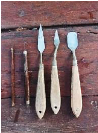
ภาพที่ 3 ภาพเครื่องมือในการแกะต้นเทียนพรรษา ของนายเพชรภูพาน หมอดอง