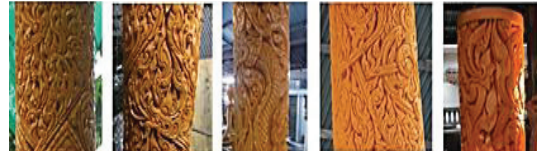
พ.ศ. 2557 พ.ศ. 2561 พ.ศ. 2562 พ.ศ. 2562 พ.ศ. 2562