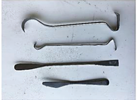
ชุดเครื่องมือพลาสติก