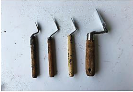
เกียงปาด