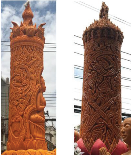
ภาพที่ 8 ภาพต้นเทียนพรรษา แกะโดย นายประเสริฐ เลิศธีรศิลป์ (ลูกศิษย์ช่างใหญ่)

3. วิธีการในการรับการถ่ายทอด รับการถ่ายทอดจากช่างใหญ่ โดยวิธี “ครูพักลักจำ” เข้าไปเรียนรู้และช่วยงานในการทำขบวนเทียนพรรษา จนได้เห็นกระบวนการและกลวิธีในการสร้างสรรค์ บวกกับช่างใหญ่ให้คำแนะนำ และสอนกระบวนการต่างๆ