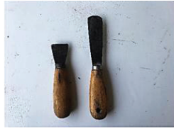
เกียงโยว