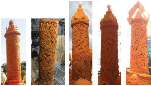
พ.ศ. 2555 พ.ศ. 2559 พ.ศ. 2562 พ.ศ. 2562 พ.ศ. 2562

3. วิธีการถ่ายทอด มีด้วยกัน 2 วิธี คือ การทำให้ดูเป็นตัวอย่าง และการลงทำมือด้วยตนเอง