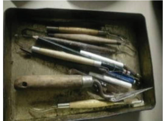
ภาพที่ 4 ภาพเครื่องมือในการแกะต้นเทียนพรรษา ของนายประเสริฐ เลิศธีรศิลป์

จากภาพเครื่องมือเครื่องมือในการแกะต้นเทียนพรรษาทั้ง 3 ภาพข้างต้น พบว่า เครื่องมือในการแกะต้นเทียนพรรษาของช่างใหญ่ และลูกศิษย์ทั้ง 2 ท่าน ประกอบไปด้วย ไม้ปั่น เกียงปาด ยังมีการประยุกต์ใช้เครื่องมืออื่น เข้ามาเพื่อช่วยให้ง่ายต่อการแกะต้นเทียนพรรษา