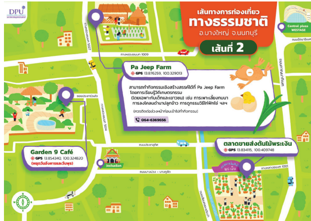
ภาพที่ 4 แผนที่เส้นทางท่องเที่ยวทางธรรมชาติในอำเภอบางใหญ่ จังหวัดนนทบุรี เส้นทางที่ 2

เส้นทางท่องเที่ยวทางวัฒนธรรม เส้นทางที่ 1 วัดสวนแก้ว บ้านสวนบัว (ตลาดน้ำพระราชวังสวนบัว) วัดดอนสะแก วัดราษฎร์ประคองธรรม และวัดพระนอน กิจกรรมเชิงสร้างสรรค์ในเส้นทาง คือ กิจกรรมของวิสาหกิจชุมชนบ้านสวนบัว เช่น การทำทองพับสมุนไพรรักษาโรค (จัดดำเนินการเป็นหมู่คณะ) การส่งเรือคลองอ้อมนนท์และคลองบางใหญ่ ชมกรรมวิธีการนึ่งปลาทุเก้แก่ที่ทำมาแล้วกว่า 80 ปี ฯลฯ (ควรติดต่อล่วงหน้าก่อนเข้าไปทำกิจกรรม) (ดูภาพที่ 5 ประกอบ)