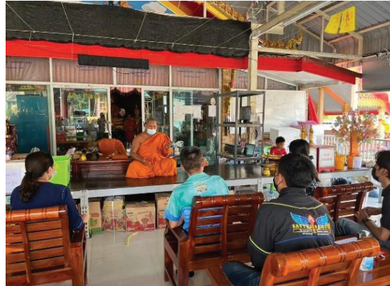
ภาพประกอบ 1 และ 2: กิจกรรมเด็กและเยาวชนภายในวัด และการสนทนากลุ่ม ที่มาภาพ: บันทึกโดยผู้ศึกษา

3. ปัจจัยความสำเร็จ แม้ว่าจะระยะเวลาของการดูแลเด็กและเยาวชนกลุ่มเปราะบางในวัดใหม่สี่หมื่นจะใช้ระยะเวลาไม่นานนัก แต่ก็สามารถพัฒนาคุณภาพชีวิตให้กลุ่มเป้าหมายได้พัฒนาตนเองและเป็นคนดีให้กับสังคมได้ ปัจจัยสนับสนุนและส่งเสริมให้สามารถดำเนินการได้อย่างต่อเนื่อง จากการสัมภาษณ์เชิงลึก และการสนทนากลุ่ม พบว่าปัจจัยความสำเร็จที่สำคัญมีดังนี้