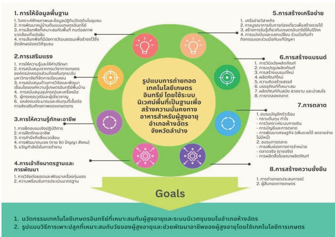
ภาพที่ 2 รูปแบบการถ่ายทอดเทคโนโลยีเกษตรอินทรีย์ โดยใช้ระบบนิเวศพื้นที่เป็นฐาน เพื่อสร้างความมั่นคงทางอาหารสำหรับผู้สูงอายุ อำเภอห่านจัต จังหวัดลำปาง

3. ด้านความเป็นไปได้ (Feasibility) มีคะแนนการประเมินเฉลี่ยเท่ากับอยู่ในระดับมาก 4.40 \pm 1.080 คะแนน โดยในประเด็นรูปแบบฯ มีความสอดคล้องกับบริบทของชุมชนสามารถนำไปใช้ได้มีคะแนนการประเมินมากที่สุด (mean = 4.60 \pm 0.49 ) คะแนน