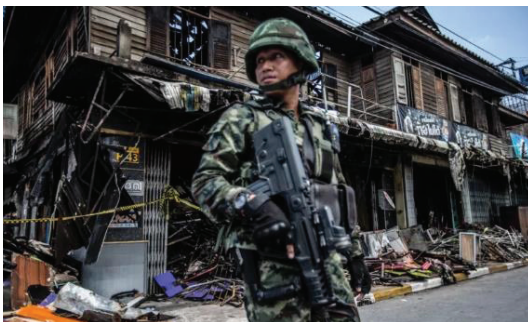
ภาพที่ 1 เหตุการณ์ความรุนแรงหลายจุดที่ จ.ยะลา ในเดือนพฤษภาคม 2558

จากปัญหาที่เกิดขึ้นเป็นเรื่องที่น่าวิตกอย่างยิ่ง เพราะเป็นความสูญเสียที่มากกว่าสงครามใดๆ ที่เคยเกิดขึ้นในประวัติศาสตร์ของประเทศไทยซึ่งผลกระทบส่งต่อเป็นวงกว้าง ทั้งทางด้านร่างกายและจิตใจโดยเฉพาะกับเด็กที่ต้องกำพร้าครอบครัว มีความหวาดกลัวฝังลึกภายในจิตใจอยู่เป็นจำนวนมาก ดังแสดงในภาพที่ 1