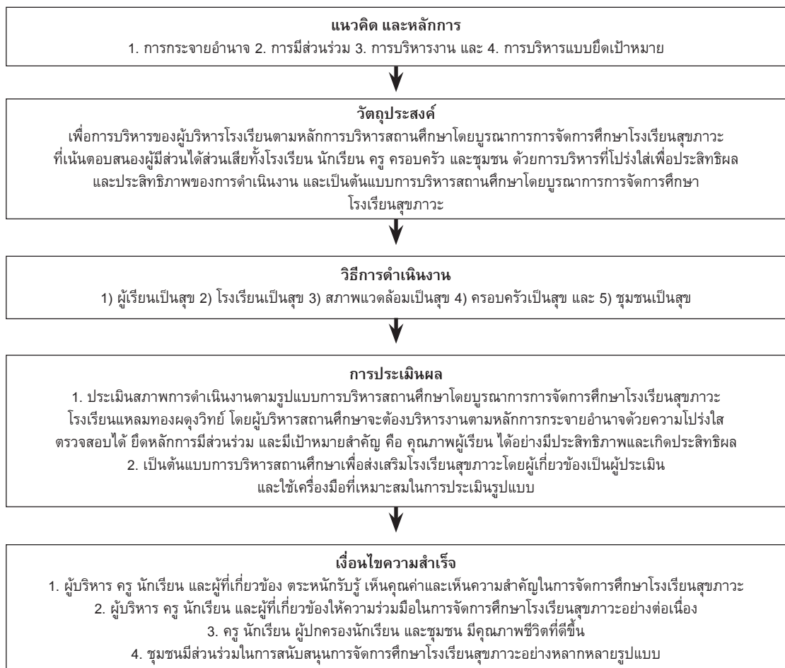
ภาพประกอบ 1 รูปแบบการบริหารสถานศึกษาโดยบูรณาการการจัดการศึกษาโรงเรียนสุภาพะ โรงเรียนแหลมทองผดุงวิทย์

5.4 ชุมชนมีส่วนร่วมในการสนับสนุนการ จัดการศึกษาโรงเรียนสุภาพะอย่างหลากหลาย รูปแบบ