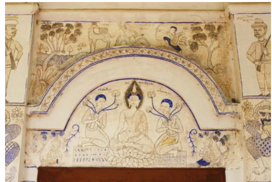
ภาพประกอบ 1 ภาพจิตรกรรมผนังภายนอกวัดพุทธสีมา

1.1 องค์ประกอบของภาพจิตรกรรมธูปแต้มวัดพุทธสีมา มีปรากฏบนผนังทั้งภายนอกและภายในของสิม (โบสถ์) ดังจะเห็นได้จากภาพประกอบ 1 และภาพประกอบ 2 ซึ่งแสดงเรื่องราวพุทธประวัติและวรรณกรรมพื้นบ้านแบบเรียบง่าย