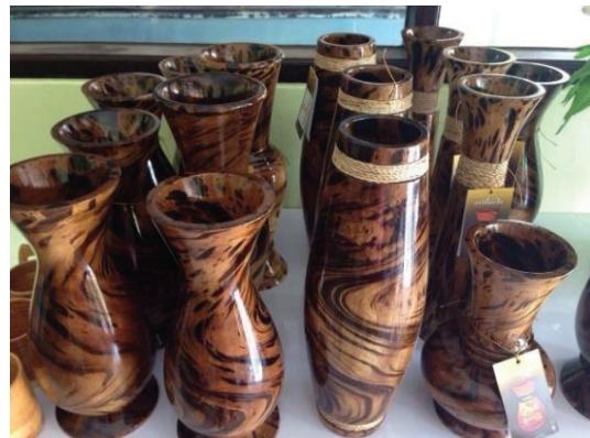
ภาพประกอบ 2 ตัวอย่างผลิตภัณฑ์ไม้กลึง

ในชุมชนลานข่อย และขยายตัวเพิ่มมากขึ้นเป็นวงกว้าง วัตถุประสงค์ที่ใช้ในการทำผลิตภัณฑ์หัตถกรรมไม้กลึงมาจากวัตถุประสงค์สองชนิดคือมาจากไม้ใผ่ตงและไม้กระถินเทพา โดยผลิตภัณฑ์ที่ทำจากไม้กระถินเทพาได้รับความนิยมจากลูกค้าเป็นอันมาก เพราะผลิตภัณฑ์ที่ได้มีลายไม้ที่เป็นเอกลักษณ์และมีความงดงามเฉพาะตัวในแต่ละชิ้น โดยไม่ต้องมีการสร้างลวดลายไม้เพิ่มเติม คุณสมบัติของเนื้อไม้เป็นเนื้อไม้ที่มีความเหนียวนุ่ม ทำให้เมื่อมีการอบและขัดเนื้อไม้จะไม่ทำให้เนื้อไม้เกิดการแตกร้าว วัตถุประสงค์ในการผลิตส่วนใหญ่หาได้ง่ายจากโรงไม้และต้นกระถินในชุมชนลานข่อย ผลิตภัณฑ์ที่ได้รับความนิยม เช่น ตะเกียงเจ้าพายุ แก้วอี แจกันดอกไม้ ป้ายไม้ต่างๆ โดยสินค้ามีการกระจายไปจำหน่ายที่ห้างสรรพสินค้าต่างๆ ของจังหวัดพัทลุง แสดงดังภาพประกอบ 2