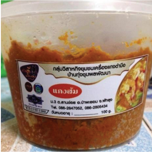
ภาพประกอบ 4 ผลิตภัณฑ์เครื่องแกงลานข่อย