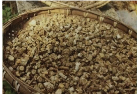
ภาพประกอบ 5 ตัวอย่างสมุนไพร

พื้นบ้านการอนุรักษ์ไว้ซึ่งภูมิปัญญาไทยในการใช้พืชพื้นบ้านรักษาโรค และรักษาวัฒนธรรมพื้นบ้านตามวิถีการแบบดั้งเดิม ในสวนสมุนไพรมีสมุนไพรประเภทต่างๆ กว่า 5,000 ชนิด ซึ่งปลูกไว้ในถุขเพาะชำ ในกระถาง ในล้อยาง และในดิน จึงทำให้สวนสมุนไพรแห่งนี้เป็ศูนย์กลางในเรียนรู้เรื่องพืชสมุนไพรให้แก่นักเรียน นักศึกษา เกษตรกร และผู้ที่มีความสนใจ อีกทั้งยังมีตำรารักษาโรคด้วยสมุนไพรพื้นบ้านมากกว่า 50 เล่ม เพื่อการเรียนรู้สำหรับแพทย์แผนไทย และการรักษาผู้ป่วยด้วยยาต้ม เช่น การรักษาตับอักเสบ-ดีซ่าน อาการปวดเมื่อยบริเวณหลัง ปวดเข่า ปวดสะโพก เจ็บสันเท้า อันเป็นสาเหตุ เนื่องจากไขมันอุดตันเส้นเลือด เป็นต้น รายละเอียดแสดงดังภาพประกอบ 5