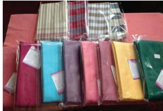
ภาพประกอบ 3 ตัวอย่างผลิตภัณฑ์ผ้าทอ

2) กลุ่มผ้าทอถ้ำลาลานข่อย เป็นกลุ่มแม่บ้านที่ได้แยกตัวออกมาจากกลุ่มทอผ้าลานข่อย เนื่องจากชาวบ้านในหมู่บ้านยากจนมีความเป็นอยู่ลำบาก การคมนาคมไม่สะดวก เกิดความลำบากในการเดินทางไปทอผ้าที่กลุ่มทอผ้าลานข่อยจึงได้แยกไปจัดตั้งกลุ่มทอผ้าถ้ำลาลานข่อยขึ้น โดยคงไว้ซึ่งรูปแบบและลวดลายในการทอที่เป็นอัตลักษณ์ของผ้าทอลานข่อยไว้ เช่น ลายดอกพะยอม ลายแก้วพรมพัฒนา ลายแก้วประยุทธิ์ ลายเพชรสงวนนาม ลายบัวสวรรค์ ลายเกร็ดแก้ว ลายแก้วบัวหลวง ลายดอกดาหลาลายกล้วยไม้ ลายแคร้แสด ลายดอกพะยอมเล็ก ลายดอกพะยอมใหญ่ ลายดอกพะยอมไพร และทางกลุ่มได้มีการจดทะเบียนวิสาหกิจชุมชนผ้าถ้ำลาลานข่อย จุดเด่นของผลิตภัณฑ์ คือ เนื้อผ้าแน่น เส้นใยมีคุณภาพ ลวดลายสวยงาม มีเอกลักษณ์ของตนเอง สีสดใส ดูแลกร่างง่าย ราคาไม่แพง อีกทั้งสามารถนำไปทำผลิตภัณฑ์อื่นๆได้มากมาย เช่น กระเป๋า ผ้ามัน ผ้าคลุมโต๊ะ ผ้าคลุมตู้เย็น และผ้าทออื่นๆ สมาชิกในกลุ่มจะเข้ามาทอผ้าหลังจากการทำสวนยางพารา บางคนนำด้ายไปทอที่บ้าน แสดงดังภาพประกอบ 3